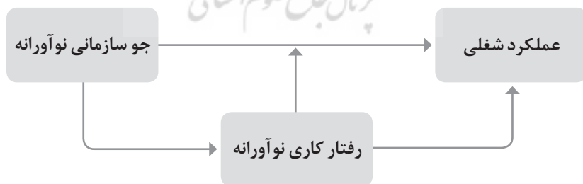
شکل ۱. چارچوب مفهومی پژوهش

امروزه نظام آموزشی برای رویارویی با چالشهای پیش‌رو، نیازمند تغییر و رفتارهای نوآورانه است که متأسفانه، مدارس ایران نوآور نیستند و وضعیت آنها به سبب نبود شرایط لازم و بروز مقاومت‌هایی در برابر نوآوریهای آموزشی رضایت‌بخش نیست. در این راستا، پژوهشها، مطالعات و طرحهایی انجام می‌شوند که همگی در تکاپوی جستن روشها و راهکارهایی برای اصلاح محیط نوآورانه در مدارس و بهبود عملکرد معلمان و به‌طور کل عملکرد نظام آموزشی هستند (حیدری‌فرد، زین‌آبادی، بهرنگی و عبدالهی، ۱۳۹۵). با توجه به بررسی مطالعات انجام شده، بیشتر تحقیقات تنها به یکی از متغیرهای موجود در این پژوهش توجه کرده‌اند و در برخی دیگر نیز فقط به بررسی نقش تعدیلگر متغیر رفتار کاری نوآورانه پرداخته‌اند و هیچ‌کدام به‌طور همزمان نقش میانجی و تعدیلگر رفتار کاری نوآورانه در رابطه بین جو سازمانی نوآورانه و عملکرد شغلی را بررسی نکرده‌اند. بر این اساس و با توجه به اهمیت وجود جو نوآورانه در هنرستانها و رفتار نوآورانه دبیران که می‌تواند منجر به تربیت دانش‌آموزان خلاق و نوآور گردد و با توجه به گزارش اداره اطلاع‌رسانی و روابط عمومی اداره کل آموزش و پرورش استان گیلان (۱۳۹۸) که نشان می‌دهد که جو سازمانی نوآورانه در تعداد کمی از مدارس استان گیلان وجود دارد و اکثر دبیران و معلمان، برای انجام وظایف شغلی خود، رفتارهای نوآورانه کمی از خود نشان می‌دهند و عملکرد چندان مناسبی نداشته‌اند (جهان‌آرای، ۱۳۹۸)، سؤال اصلی تحقیق این است که آیا رفتار کاری نوآورانه در ارتباط بین جو سازمانی نوآورانه و عملکرد شغلی دبیران هنرستانهای فنی و حرفه‌ای استان گیلان نقش میانجی دارد؟ با توجه به مطالعات انجام شده، چارچوب مفهومی پژوهش به شکل زیر خواهد بود: