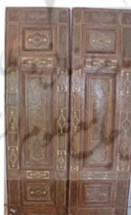
شکل ۷: در ورودی محفوظ در موزه بنیاد مستضعفین

ویژگی‌های فیزیکی در ورودی محفوظ در موزه ملی ایران در ورودی با شماره اموال ۲۶۲۹۵ به مالکیت موزه ملی ایران و با ابعاد ۲۱۰ سانتیمتر طول، ۱۱۵ سانتیمتر عرض و قطر ۱۰ سانتیمتر در سالن موزه در بخش اسلامی محفوظ است (شکل ۸). در هر لنگه، نقوش هندسی، گردان و خط