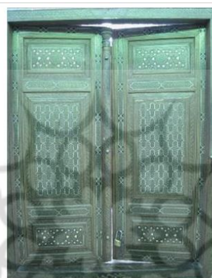
شکل ۱۱: در ورودی آستان مقدس امامزاده زید(ع) در تهران

شیرازی ساکن دارالخلافه ۱۳۰۱" به خط فارسی و گونه‌ی نستعلیق، از جنس استخوان و روی زمینه‌ای از چوب تیره (به احتمال فوفل) مشاهده می‌گردد (شکل ۱۲). بخش‌هایی از کتیبه، چارچوب در و لنگه سمت چپ آسیب‌دیده که ممکن است در اثر بی‌توجهی در آینده‌ای نه چندان دور خسارت‌های جبران‌ناپذیری را نیز متحمل شود؛ اثر مذکور به احتمال در دهه ۷۰ شمسی مرمت غیراصولی شده است [۳۴]. این در به‌عنوان اثر میراث فرهنگی و ملی در حال حاضر همه روزه در معرض تماس زائرین بدون در نظر داشتن مسائل حفاظتی است.