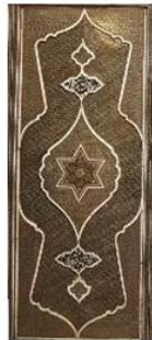
شکل ۱۳: در ورودی محفوظ در موزه ملی ایران، شیوهی خاتم معرق، مأخذ: نگارنده