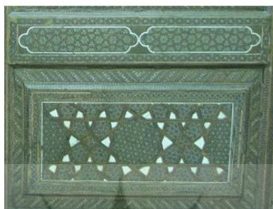
شکل ۱۴: بخشی از در ورودی آستان مقدس امامزاده زید(ع) در تهران، خاتم معرق، مأخذ: نگارنده

«گره عبارت از اشکال مختلف غالباً هندسی است که به طور هماهنگ در یک کادر مشخص در کنار هم قرار گرفته باشند. هر زمینه گره یا به اصطلاح آلات گره مجموعه‌ای از اشکال هندسی است که به هر یک از آنها آلت گره می‌گویند» [۳۵].