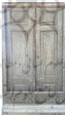
شکل ۵: در ورودی عمارت تخت مرمر، مجموعه جهانی کاخ گلستان، مأخذ: نگارنده

محفوظ در موزه های ملی و موزه بنیاد مستضعفان در تهران و ... اشاره نمود (شکل ۶، ۷). از مهم ترین دلایل انتخاب در ورودی امامزاده زید (ع) و در ورودی محفوظ در موزه ملی دارا بودن دو مؤلفه ی شاخص نوآوری در خاتم کاری دوره قاجار در این دو اثر است. از جمله نوآوری ها در شیوه ی خاتم کاری این دوره بروز شیوه جدیدی با عنوان "خاتم-