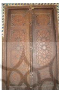
شکل ۴: در ورودی مدرسه چهارباغ اصفهان

در این صورت می توان گفت درهای ورودی خانه ها اغلب متناسب با قد انسان، دو لنگه و چوبی و دارای کوبه های زنانه و مردانه است و درهای ورودی کاروانسراها متناسب با فضای ورودی کاروان ها و مسائل امنیتی اغلب چند لنگه و در مواردی فلزی است. در این راستا اشاره می شود درهای ورودی ابنیه عمومی و همچنین ابنیه مذهبی به لحاظ تناسب و تزیینات به طور معمول بزرگ تر و پر تزیین تر و درهای ورودی بناهای غیر مذهبی اغلب کوچک تر بوده که متناسب با