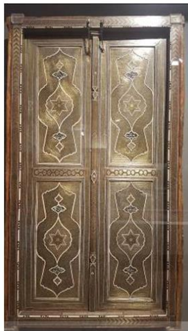
شکل ۸: در ورودی محفوظ در موزه ملی ایران

مشاهده می‌گردد. نقوش خط و کتیبه با مضمون مدح و ثنای شاه، نام سازنده و سال ساخت (محمدحسین شیرازی سنه ۱۲۷۶) بوده که به خط فارسی و گونه‌ی نستعلیق، جنس استخوان و روی زمینه‌ای از چوب تیره (به احتمال فوفل)