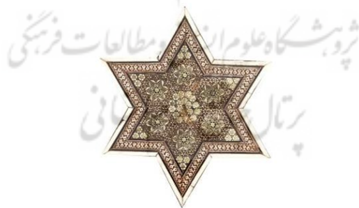
شکل ۱۵: بخشی از در ورودی محفوظ در موزه ملی ایران، خاتم به شیوه‌ی چیدمان گره، مأخذ: نگارنده

از دیگر نوآوری‌هایی که در هر دو اثر مورد مطالعه قابل مشاهده بوده استفاده از خاتم به شیوهی چیدمان گره است. چیدمان خاتم داخل زمینه‌ی گره (لُغَت-لُغَط-لُقَط) ، روشی مناسب برای پر کردن زمینه‌ی اثر است (شکل ۱۵، ۱۶).