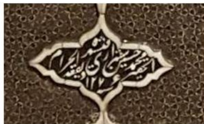
شکل ۱۰: بخشی از در ورودی محفوظ در موزه ملی ایران، نام سازنده و سال ساخت اثر