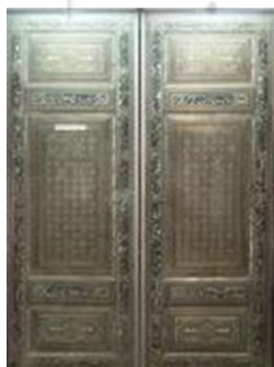
شکل ۱: در ورودی محفوظ در موزه ملی ایران

مطالعات صورت گرفته، اسنادی و در عین حال ترکیبی بوده و در آن از رهیافت‌های زمینه‌ای استفاده شده است. پژوهش‌های ترکیبی ماحصل روش‌های کیفی و کمی هستند. بر این اساس، گردآوری نظریات مختلف بر پایه مطالعات کتابخانه‌ای و اسنادی از کتب و پایگاه‌های مختلف اطلاعاتی انجام شده است؛ در همین راستا از روش‌های توصیفی تحلیلی مؤلفه‌های نوآوری در خاتم کاری دوره قاجار بررسی و تحلیل شده‌اند. سپس مؤلفه‌های نوآوری در آثار مورد مطالعه بررسی و تحلیل شده است و در نهایت داده‌های به دست آمده با روش کیفی مورد سنجش واقع شده است. در بخش کمی از روش میدانی شامل شکل برداری و مصاحبه با اساتید استفاده شده است. در این پژوهش رویکرد