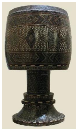
شکل ۲: تنبک محفوظ در مجموعه میراث جهانی کاخ گلستان