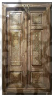
شکل ۶: در ورودی محفوظ در موزه ملی ایران

معرق " است. این شیوه در زیبایی اثر سهم به‌سزایی داشته و نمونه‌هایی از آن در زمره زیباترین آثار خاتم‌کاری بوده و زینت‌بخش موزه‌ها و گنجینه‌های هنری شده است. همچنین از دیگر نوآوری‌ها که در شیوه‌ی ساخت خاتم این دوره بوده، مربوط به خاتم‌های گره است. چیدن خاتم داخل زمینه‌ی گره (لُغْت-لُغَط-لُغَط) بوده که روشی مناسب برای پر کردن زمینه‌ی گره است [۳۳]. شیوه‌ی خاتم معرق از روش‌های تزئینی در خاتم‌کاری است؛ روش کار در این شیوه به این صورت بوده که پس از رسم طرح در محل اجرای خاتم معرق، از خاتم‌های رنگی -اغلب پره‌ای- استفاده می‌شود. در این شیوه قبل از برش خاتم اطراف شکل مورد نظر را با مداد سیاه پررنگ می‌نمایند. سپس ورق خاتم را از پشت روی آن گذاشته و فشار داده به طوری که نقش شکل مورد نظر پشت