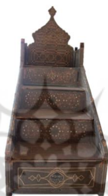
شکل ۳: منبر محفوظ در مجموعه میراث جهانی کاخ گلستان

فیزیکی اثر درگذر زمانی روی خواهد داد و تغییرات دگرگونی زمان در حفاظت از ارزش‌ها تأثیرگذار است» [۳۱]. خاتم‌کاری به‌مثابه بخشی از تزیینات معماری چوبی در ورودی یکی از عناصر مهم بنا است که کارکرد اصلی آن ارتباط با فضاهای بیرون و درون بنا است. در واقع می‌توان اشاره نمود این بخش از بنا با ایجاد عامل مکث یا با عقب‌نشینی از معبر عمومی، عنصری شاخص در بناهای مذهبی و غیرمذهبی است. از آن‌جا که در ورودی در معرض دید عموم قرار می‌گیرد، می‌بایست تشخیص داشته باشد. به‌طور معمول در یک بنا یکی از درهای ورودی که اصلی بوده را برای زیباتر جلوه دان و همچنین تشخیص بیشتر تزیین می‌نمودند و این درها با ظرافت و دقت بیشتر ساخته و تزیین می‌شده است. بستگی به کارکرد در ورودی، درجه استحکام آن متفاوت است. به‌طور مثال درهای ورودی کاروانسراها