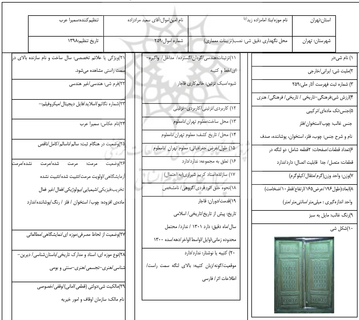
جدول ۲: اطلاعات تخصصی-تاریخی در ورودی امامزاده زید (ع)، مأخذ: نگارنده