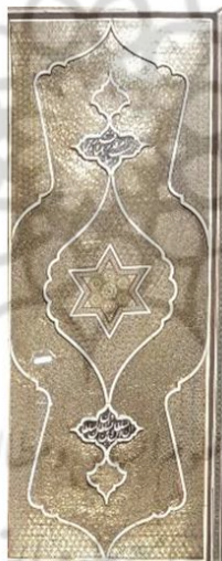
شکل ۹: بخشی از در ورودی محفوظ در موزه ملی ایران، کتیبه به خط فارسی و گونه‌ی نستعلیق