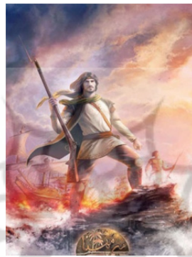
تصویر ۱. بازی رایانه‌ای میرمهنا

شرکت بازی‌سازی اسپریس پویانما با مشارکت بنیاد ملی بازی‌های رایانه‌ای در سال ۱۳۹۰ بازی را منتشر کرده‌اند. بازی در سبک اکشن اول شخص تاریخی بوده و هم‌چنین اولین بازی رایانه‌ای ملی است. این «بازی با داستانی برگرفته از کتاب بر جاده‌های آبی سرخ، براساس دلیر مردی‌های میرمهنا جنگویی در دوره‌ی کریم‌خان زند ساخته شده، که بر ضد استعمار هلند و انگلستان می‌جنگیده است» (اقدسی و همکاران ۱۳۹۱: ۹۳).