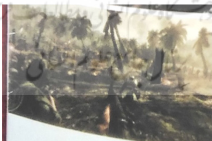
تصویر ۸- درگیری در منطقه‌ی دشمن.

قهرمان با عبور از موانعی که دشمن بر سر راه آن‌ها قرار داده است؛ و پا پس نکشیدن از مبارزه تا پیروزی و پیشروی در منطقه دشمن در مناطق جنگی و با حمله‌هایی در (خشکی، هوایی و دریایی) که میان مردان ارتش آمریکا و دیگر کشورهای درگیر جنگ اتفاق می‌افتد همچنان به مافوقش وفادار است. او در ادامه‌ی بخش‌های دیگر بازی به‌عنوان پدیرنکوف حضور دارد و این‌بار همراه روسی‌اش او را راهنمایی می‌کند. او همه‌ی دشمنان را از سر راه بر می‌دارد و این آزمون را که فصل دوم سفر قهرمان است با پیروزی به اتمام می‌رساند؛ بازی کاملاً در دنیای مردانه است و هیچ وسوسه‌ی زنانه‌ای وجود ندارد تا قهرمان را از ادامه‌ی مبارزه باز دارد.