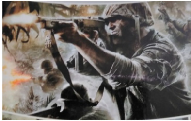
تصویر ۴- بازی رایانه‌ای ندای وظیفه

بدان اشاره شد قهرمان هدفی جز آزادی سرزمینش در راه کمک به نیازمندان ندارد و در این راستا هیچگاه به حریم یا حقوق دیگران تعرض نمی‌کند.