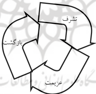
شکل ۱: مراحل سه‌گانه اصلی کهن الگوی سفر قهرمان کمبل

«سفر قهرمان مدلی انعطاف‌پذیر و قابل انطباق است و می‌تواند اشکال و زنجیره‌های بی‌نهایت متنوعی از مراحل را در خود جای دهد؛ به عبارت دیگر بسته به نیازهای هر داستان می‌توان مراحل سفر را حذف یا تکرار یا جابه‌جا کرد» (ویتایلا، ۱۳۹۰: ۹). زیرا بیشتر داستان‌ها و اسطوره‌ها تمام این مراحل را دارا نیستند و بعضی فقط روی یکی یا بعضی از این مراحل تمرکز دارند.