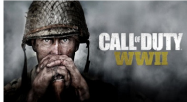
تصویر ۲. بازی رایانه‌ای ندای وظیفه www.activision.com call of duty world at warIII)