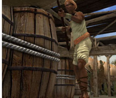
تصویر ۶. ورود قهرمان و یارانش در انبار مهمات دشمن در منطقه زندگی قهرمان، ماخذ: بخش‌هایی از بازی میرمهنّا؛ اخذ شده توسط نگارندگان ۱۴۰۰