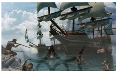
تصویر ۵- قهرمان و یارانش در مقابل کشتی دشمن در منطقه،

منطقه شوند. دوستان شبیر که به‌همراه او زنده مانده‌اند برای حمایت از میرمهنا و دفاع از خاکشان با او همراه می‌شوند. اگرچه اشغالگران خواهر شبیر، حنانه و همسرش سعید را به گروگان گرفته‌اند تا او را از حمایت میرمهنا باز دارند اما او دعوت دشمن را نمی‌پذیرد و به‌سوی مکان خواسته شده، یعنی جایی که میرمهنا در انتظار اوست می‌رود تا با همراهی دیگر جوانان آبادی و رهبرشان میرمهنا اشغالگران را بیرون برانند. قهرمان با ورود به دنیایی جدید که مرحله عبور از جوانی و دنیای مبارزه است، وارد مرحله بعد یعنی شکم‌نهنگ می‌شود و بدین ترتیب فصل اول سفر قهرمان با این حرکت بزرگ تمام می‌شود.