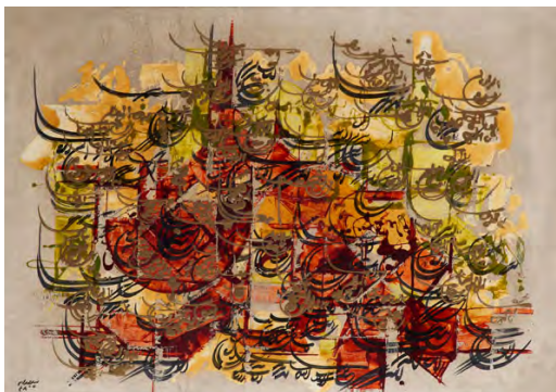
تصویر ۳: بدون عنوان، اثر فرامرز پیلارام، ۱۳۴۸، رنگ و روغن روی بوم، ۷۰×۱۰ سانتی متر (منبع: سایت حراج تهران 3 URL).