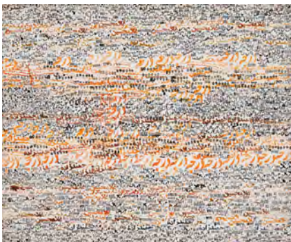
تصویر ۲: طلا + ریال، اثر حسین زنده‌رودی، ۱۳۵۳، اکریلیک روی بوم، ۶۰×۷۳ سانتیمتر.

در «تصویر ۲»، با عنوان «طلا + ریال»، متعلق به سال ۱۳۵۳ش، سنت سیاه‌مشق ایرانی در قالب پرده‌ای نقاشانه بازنمایی شده است. بدین‌گونه بیان اندیشه و احساس هنرمند با بهره‌مندی از مشق حروف که وجهی ذاتی در شیوه نقاشی خط ایرانی است و سپس تلفیق عناصر بصری در شکلی ساختارشکنانه باعث خلق یکی از متمایزترین آثار زنده‌رودی شده است. این تابلو با ترکیب حالات حروف و چیدمان اجزای صرفاً فرمی و خالی از معنا در بستر افقی شکل گرفته است و به لحاظ مفهومی استعاره‌ای از تناوب دارد. با این حال استفاده هوشمندانه از تکنیک اکریلیک برای ایجاد ته‌رنگ‌هایی شفاف و درخشان تماشاگر را با تابلویی مملو از شاعرانگی شرقی روبه‌رو می‌سازد. عناصر بصری در این تابلو در ذات اصلی خود کیفیتی انتزاعی دارند. ریتم شکل‌ها و ته‌رنگ‌های ملایم و هموار، فارغ از قواعد کلاسیک و شکل غالب زیبایی‌شناسی در خوشنویسی همگی بیانگر جلوه‌هایی از هنر مدرن هستند. در اینجا فرم و رنگ در قامت شخصیتی مبهم و تجریدی به شیوه خیال‌انگیز نمایان شده‌اند و آفرینش اثر در پیروی از حالات درونی هنرمند شکل گرفته است. به این ترتیب آنچه بیش از هرچیز به رویکرد نو-سنت‌گرایی اشاره دارد گرایش به انتزاع تغزلی است چراکه از یک سو به روحیه کنشگر هنرمند اشاره می‌کند و از سوی دیگر به مکاشفه، خلق معنا و تعامل احساسی از جانب مخاطب می‌پردازد و از همین رو گرایش به جهان هنر انتزاع تغزلی (اکسپرسیونیسم انتزاعی) در این اثر آشکار می‌گردد.