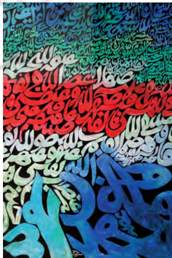
تصویر ۱: ص + ه + ص، اثر حسین زنده‌رودی، ۱۳۵۲، اکریلیک و رنگ‌ریزه معدنی روی بوم، ۲۱۲×۱۴۲ سانتیمتر.

در همین راستا در «تصویر ۱» با عنوان «ص + ه + ص» متعلق به سال ۱۳۵۲ش، عنصرخط در قامت موتیف‌هایی نافذ به کار رفته و عناصر در هارمونی کامل با یکدیگر قرار گرفته‌اند. فضای بصری شکل گرفته به مدد هماهنگی بین رنگ‌ها و فرم‌های درهم تنیده، تماشاگر را با جهان سرشار از رهایی هنرمند مواجه می‌سازد. در اینجا جسارت سنت‌شکنی و دفرمه کردن فرم حروف و استفاده از رنگ‌های مکمل به همراه ایجاد بافت با خاکستری رنگی و سپس قراردادن آن بر زمینه‌ای سیاه، گویای برخورد نوگرایی زنده‌رودی است. وی در مورد استفاده از حروف اینطور اذعان می‌دارد: «من به فرم خیلی معتمد و روی آن کار می‌کنم. خیلی‌ها فکر می‌کنند من می‌خواهم خوشنویسی کنم. درحالی‌که می‌توانم بگویم که در مورد خط، من می‌خواهم بدنویسی کنم. مسئله مهم این است و فرم باید ایده‌ام را بیان کند» (مجابی، ۱۳۹۵: ۱۹۱). با این نگاه، واضح است که در میان بنیان‌گذاران نهضت سقاخانه، زنده‌رودی را باید پیشگام رویکرد خط‌نگاری از حیث بهره‌مندی از خط و خوشنویسی سنتی در حکم فرم ساختاری صرف، قلمداد کرد (کشمیرشکن، ۱۳۹۶: ۱۲۸). اما در این اثر آنچه بیش از هرچیز معنای نو-سنت‌گرایی را جلوه‌گر می‌سازد، برخورد شکلی هنرمند با عناصر آشنای ایرانی است. این نحوه مواجهه با عناصر بصری در بستر یک اثر تجسمی، نشان از تفکر نوگرایی و گرایش