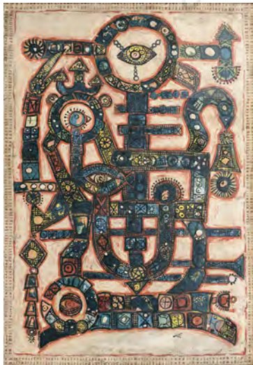
تصویر ۵: بدون عنوان، اثر منصور قندریز، اوایل دهه ۱۳۴۰، ترکیب مواد روی گونی، ۱۱۰×۱۵۸ سانتی‌متر.

منصور قندریز (۱۳۴۴-۱۳۱۴ ش) در ابتدا با سطوح رنگی تخت و روشن، خط‌های شکل‌ساز نرم و پیکره‌های بلند قامت و کوچک‌سر در جامگان ساده و خشن روستایی شناخته می‌شد. در ادامه، نقش‌مایه‌های آثار وی شامل: شکل‌های نیمه‌انترزاعی انسان، پرنده، خورشید، شمشیر، سپر آمیخته با نقوش هندسی پرتکرار شونده، فضای محدود شده در حاشیه است (پاکباز، ۱۳۸۳: ۳۸۷). وی با تأکید بر سرچشمه‌های غنی تصویری بر مبنای تمثیل‌های ایرانی، آثاری بدیع را با بیانی شخصی خلق کرد. از ویژگی‌های متمایز در آثار او، شمایل‌نگاری چکیده‌محور بر پایه نمادهای فرهنگ بومی است. در تابلوی شماره ۵، متعلق به دهه ۱۳۴۰ ش، در آغاز،