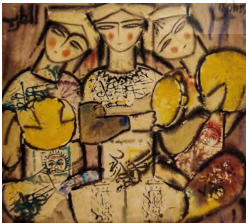
تصویر ۸: بدون عنوان، اثر ناصر اویسی، دهه ۱۳۴۰، رنگ و روغن روی پارچه کشیده شده روی فیبر، ۷۷×۸۶ سانتی متر.

تابلوی شماره ۸ متعلق به دهه ۱۳۴۰ش، از دیگر آثار ناصر اویسی است که بر مبنای نقش‌مایه‌های ایرانی خلق شده است. پیکر زنان نوازنده، نقش خورشید خانم ایرانی و حالت چهره زنان، در کنار خط‌نگاری از ویژگی‌هایی است که مختص آثار اویسی محسوب می‌شود و نشان از رهیافت وی به سمت نوعی از تصویرگری و نقاشی دارد که در آن روح شاعرانه شرقی در جریان است. از نمودهای شاخص نو - سنت‌گرایی اشاره به حالت چهره و پیکرها در کنار یکدیگر و در کل ترکیب اثر است. در اینجا زنان خنیاگر با چشمان درشت و خماری، گونه‌های سرخ و لب‌های کوچک و غنچه، در حالت رامشگری به نمایش درآمده‌اند که این نشانه‌ها، الهامات هنرمند را از هنر پیکرنگاری درباری قاجار هویدا می‌سازد. مبنی بر این، قراردادهای زیبایی‌شناسی با مضمون زنان در دربار قاجار شامل: «زنان با چهره بیضی، ابروان پیوسته، چشمان سرمه کشیده و انگشتان حنا بسته در حالتی مخمور به تصویر درآمده‌اند» (پاکباز، ۱۳۷۹: ۱۵۰). افزون بر این، از دیگر الهامات از مکتب پیکرنگاری درباری در قالب هندسه پنهان، بهره‌مندی از رنگ‌های گرم زرد و قرمز و تلفیق عناصر بصری و تمایل به انتزاع و چکیده‌نگاری خود را به نمایش می‌گذارد. نقش‌مایه دیگر این اثر، نگاره خورشید خانم ایرانی است که به مفاهیم آیینی و فرهنگی اشاره می‌کند. این نگاره از نقوش رایجی است که در موقعیت‌های گوناگون در هنر ایران به ویژه در قالی‌های تصویری و سنتی مورد