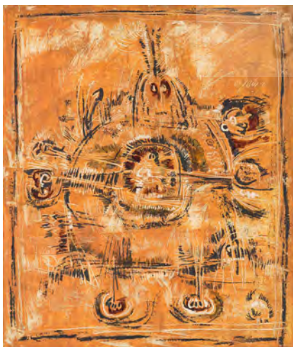
تصویر ۱۲: بدون عنوان، اثر مسعود عربشاهی، ۱۳۵۲، ترکیب مواد روی بوم، ۱۱۰ × ۱۳۰ سانتی متر.

تابلوی شماره ۱۲، متعلق به سال ۱۳۵۲ ش، دارای بیان رمزآمیز است و به دلیل تجربیات عربشاهی در زمینه نقش‌برجسته، تأثیرات این هنر را به لحاظ برخورداری از بافت در تصویر مشهود می‌سازد. از نمودهای نو-سنت‌گرایی در این اثر، اشاره به فرم‌های دایره‌محصور شده در یک مربع یا چهارگوش، به همراه طیف رنگ‌های زرد مایل به قهوه‌ای (اخرایی)، سفید و سیاه که یادآور شمایل مقدس ماندالا است و به مفاهیمی معنوی همچون مراقبه و خویشتن اشاره دارد. از سویی دیگر بهره‌مندی از فرم‌های هندسی مربع و دایره است که در حوزه معماری باستانی ایران از جمله چهارطاقی‌ها مورد استفاده قرار می‌گرفته و بیانی نمادین و سمبولیک داشته است به طور مثال: «معابد چهارگوش که