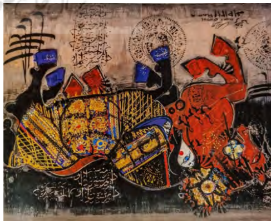
تصویر ۷: رخس، اثر ناصر اویسی، ۱۳۴۴، اکریلیک روی بوم، ۱۲۲×۱۰۶ سانتی متر. کاخ موزه صاحبقرانیه، مجموعه نیاوران. (کشمیرشکن، ۱۳۹۶: ۱۵۱)