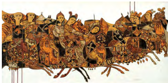
تصویر ۱۰: بدون عنوان، اثر صادق تیریزی، دهه ۱۳۶۰، اکریلیک روی بوم، ۹۸×۱۹۸ سانتی‌متر.

اثر شماره ۱۰، متعلق به دهه ۱۳۶۰ش، دارای ساختار یکپارچه از عناصر بصری است. ادغام فیگورهای سوار بر اسب در حالت حرکت و با نگاه رو به مخاطب، استفاده از عناصر بصری تزیینی بر پیکره اسب‌ها، بهره‌مندی از شمشیر، کمان و خنجر و کاربست رنگ‌های گرم نارنجی، نخودی، قهوه‌ای و سیاه در مجاورت با یکدیگر، جملگی یادآور سنت فرنگی‌سازی صفویه و پیکرنگاری درباری قاجار است. همچنین قطع اثر در حالت افقی و در اندازه ۹۸×۱۹۸ سانتی‌متر، به صورت ضمنی به دیوارنگاره‌های