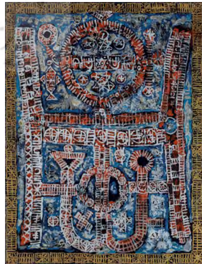
تصویر ۶: بدون عنوان، اثر منصور قندریز، اوایل دهه ۱۳۴۰، ترکیب مواد روی گونی، ۹۱×۶۸ سانتیمتر.

تابلوی شماره ۶ که در اوایل دهه ۱۳۴۰ش خلق شده است از دیگر آثار متمایز قندریز محسوب می‌گردد که به درستی تأویل وی را بر مبنای مدرنیسم ایرانی بازگو می‌نماید. از این روی، جوهر درونی اثر بر مبنای نقوش ساده هندسی شکل گرفته است اما همین نقوش ساده در ترکیب با یکدیگر و سپس به صورت کلی در پهنه اثر، جلوه‌ای فیگوراتیو پیدا کرده و پیکر انسان را قابل دریافت می‌سازد. از سویه‌های دیگر مفهوم نو- سنت‌گرایی در این اثر، روانی در خلق نقش‌مایه‌ها بر مبنای تخیل آزاد هنرمند است که این شیوه در بیان تجسمی وی، اقتباسی از دست‌بافته‌های محلی ایرانی محسوب می‌گردد. «قندریز، هنرمندی با آثار نیمه‌انتزاعی بود که منبع الهامش نقش‌مایه‌های چکیده‌شده ایرانی با تأکید بر اشکال ایلباتی، بافته‌های روستایی و محلی ایرانی، فلزکاری‌های سنتی و انواع صنایع دستی بود که با رنگ‌بندی محدود در آثارش به کار می‌برد. برخی دیگر از منابع الهام وی اشکالی از هنرهای کاربردی همچون قالیچه، فرش و دیگر صنایع دستی بودند» (کشمیرشکن، ۱۳۹۶: ۱۳۹). همچنین تأثیر وی از اشکال منظم و ریتمیک هنرهای سنتی در قالب اثری با مؤلفه‌های مدرنیستی