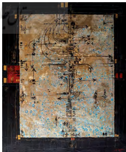
تصویر ۱۱: بدون عنوان، اثر مسعود عربشاهی، ۱۳۵۴، ترکیب مواد روی بوم، ۱۱۰ × ۱۱۹ سانتی متر.