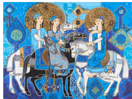
تصویر ۹: سه سوار، اثر صادق تیریزی، ۱۳۷۵، اکریلیک و ورق طلا روی بوم، ۱۰۳×۱۳۷ سانتی‌متر.