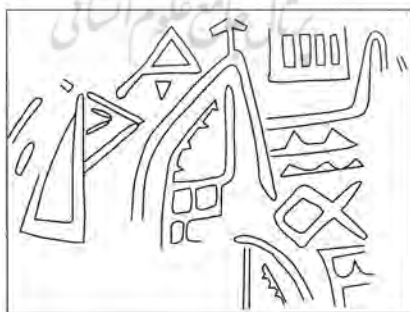
نماد شهر اور بر روی مهرشهر بین‌النهرینی به دست آمده از جیرفت با تاریخ حدود ۲۹۰۰ پ.م (برگرفته از ۲۰۰۸، مجیدزاده و پیتمن)

بر اساس مطالب مندرج در متون تمدن بین‌النهرین، ازدواج‌های سیاسی میان سارگون‌اکدی و مرهشی، مربوط به ازدواج میان پسری از نرام - سین و یک شاهزاده‌ی مرهشیایی و ازدواج دختر شولگی دومین فرمانروای سلسله‌ی اور سوم با پادشاه مرهشی می‌باشد. (مجیدزاده، ۱۳۸۷: ص ۱۱) / استنکسر عقیده دارد و تصاویر حکاکی شده بر روی ظروف اکتشافی تمدن جیرفت، متعلق به زوج رودروست که حکایت دارد از یک رویداد مهم که همان ازدواج سیاسی و با اهمیت میان دو خانواده‌ی شاهی مرهشی و بین‌النهرین است. همچنین تایید باستان‌شناسان مبنی بر وجود ارتباط قوی میان مرهشی و بین‌النهرین که در دوره‌ی (۲۳۰۰-۱۷۰۰ پ.م) تمدن جیحون در زمینه‌های متعدد با عیلام و بین‌النهرین (اکد و اور سوم تا زمان حمورابی) بوده است، قابل توجه است. (مجیدزاده، ۱۳۸۷: ص ۱۶۶). پال فرانکفورت می‌گوید و کشف حدود ده قطعه اثر مهر که شباهت بسیار به مهرهای شناخته شده در گورستان سلاطین اور داشته، به دوره‌ی سوم سلسله‌ی قدیم، حدود ۲۴۰۰ ق.م نسبت داده شده است. (مجیدزاده، ۱۳۸۷: ص ۴۲) پیتمن عقیده دارد که در خصوص وجود مهرهای کشف شده‌ی متعلق به فرمانروایی کنارصندل در این منطقه باید گفت تعدادی از مهرهای کشف شده‌ی مربوط به منطقه‌ی بین‌النهرین است که در سومر کاملاً مرسوم بوده است. اثر «مهرشهر» بین‌النهرینی به دست آمده از جیرفت مربوط به دوره‌ی سلسله‌ی قدیم اول یعنی حدود ۲۹۰۰ پ.م است (مجیدزاده و پیتمن، ۲۰۰۸: ۶۹-۱۰۳) که در یکی از این مهر شهرها نماد شهر اور در سمت چپ کاملاً واضح می‌باشد.