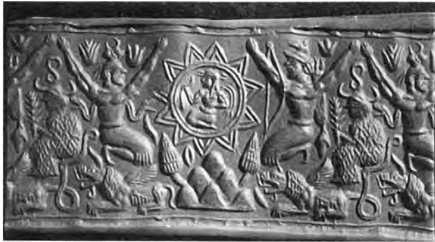
تصویر شماره‌ی سه، نیویورک

نیویورک هر دو می توان مشاهده کرد که ثابت کننده‌ی جایگاه بالای افرادی است که در تصویر مهرهای جیرفت حکاکی شده‌اند و در حال انجام نمایش آیینی می‌باشند.