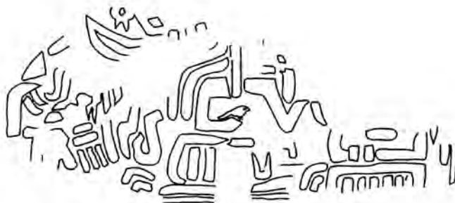
تصویر شماری چهار متعلق به کشفیات کنارصندل

قرارگرفتن مرد در سمت راست با هم عوض شده است؛ مرد که طره‌ای از موهایش در جلو و روی‌شانه افتاده است، پرنده‌ای را به دست راست گرفته است و دست چپ را که از آرنج خم شده به سمت جلو دراز کرده است. تنها تخته‌های عمودی سکوست که حضور شخصیت نشسته رو در روی او را تایید می‌کند که به جای مانده است. (مجیدزاده، ۱۳۸۳: ص ۶۰).