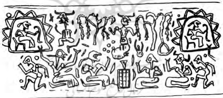
تصویر شماره‌ی یازده، آمیه

همچنین در خصوص صحنه‌ی تقابل شخصیت‌ها که ظرفی آن‌ها را از هم جدا می‌سازد می‌توان این تقابل را در تصویر ردیف پایین مهر استوانه‌ای مجموعه‌ی شخصی آمیه که در ذیل این مطلب آمده است نیز مشاهده نمود.