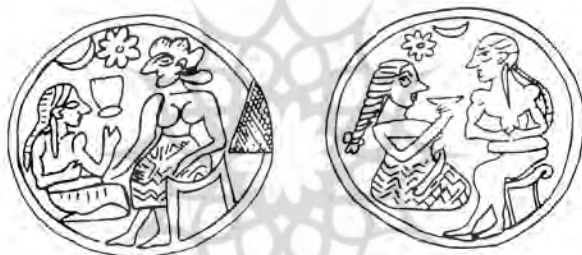
تصویر شماره‌ی دوازده متعلق به موزه‌ی لوور

که در نمونه‌ی موزه‌ی لوور دو نسخه‌ی متفاوت از صحنه‌ی تقابل شخصیت‌ها را نشان می‌دهد؛ در سمت راست این طرح، در یک سمت مردی با طره‌ی موی بلند، هر دو دست را تا کمر بالا آورده و بر چارپایه‌ی دسته‌داری با انتهای تزیینی قوسدار نشسته است و روبه‌روی او زنی است با موهای بلند آویخته که زیر دامن طرح‌داری زانو زده یا چهارزانو نشسته است. وی جامی مخروطی را در برابر لبانش نگاه داشته است؛ در بالا و میان آن‌ها یک هلال ماه بالای سر مرد و یک گل بالای سر زن وجود دارد. سمت دیگر این سنگ لاجورد گرد همان شخصیت‌ها را با ارتباط معکوس نشان می‌دهد. اکنون زن با موهای جمع شده در بالا، بر چهارپایه‌ای با کف قوسدار نشسته است و دست‌هایش را در پهلوها نگاه داشته و به نظر می‌رسد دامن مرد را که روبه‌رو و در سمت چپ او چهار زانو نشسته است، لمس می‌کند. مرد دست چپ خویش را تا برابر دهان بالا آورده و دست راست را در سطح نگه داشته است. جام مخروطی شکلی در برابر صورتش در هوا معلق است. در فضای بالا و میان آن‌ها همان هلال و گل، اما این بار در حالت عکس، یعنی هلال در بالای سر مرد و گل بالای سر زن قرار دارد. لبه‌ی این سنگ لاجورد گرد با تزیین‌کننده‌ی ظریف طرح ریسمانی تابیده در هم، تزیین شده است. اگر چه ارائه‌ی تعبیری قطعی امکان‌پذیر نیست، اما این بازنمود مرکب آشکارا دو مرحله از یک ارتباط مجرد میان یک زن و مرد را عرضه می‌کند (مجیدزاده، ۱۳۸۳: ص ۶۳).