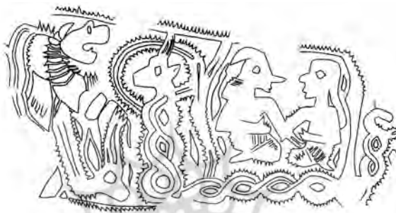
تصویر شماره‌ی شش کشفیات کنارصندل جنوبی

از شمایل‌نگاری بر جای مانده است که به واقع کامل است؛ صحنه‌ی تقابل دو انسان که با صحنه‌هایی از پیکار دو جانور افسانه‌ای ترکیب شده است. در این صحنه تقابل دو شخصیت به حالت زانو زده نشان داده شده‌اند تا نشسته بر سکو و شخصیت سمت چپ با قضاوت از روی کلاه دم‌حیوان، مردی است با بینی بسیار کشیده و نوک تیز که دست راست را بر کمر نهاده، و دست چپ را به منظور لمس کردن دامن شخصیت مقابل دراز کرده است و شخصیت مونث روبه‌روی او بر زانو نشسته است، هر دو دست او را در حالتی کاملاً مشابه گرفته و موهای بلند او پشت سرش فرو ریخته است. بینی وی اگرچه برجسته است اما به بزرگی بینی مرد نیست». (مجیدزاده، ۱۳۸۳: ص ۶۱). بدون شک این تصویر حکایت از باز طراحی آیینی چون زناشویی و یا ازدواجی مهم متعلق به آن سرزمین دارد که هنرمند حکاک بر روی سنگ نقش‌نگاری کرده است.