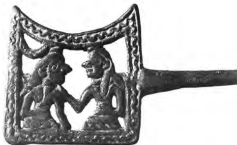
تصویر شماره‌ی هشت متعلق به موزه‌ی لوور

قرار داد با موهای بلندی که در پشت سر آویخته و طره‌مویی که از روی شانه در جلوی بدن آویزان است. او شانه‌ی زن را لمس می‌کند (مجیدزاده، ۱۳۸۳: ص ۶۲).