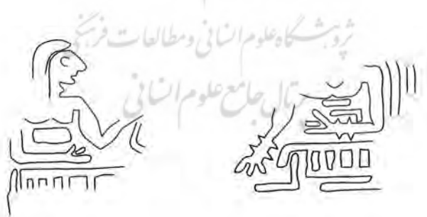
تصویر شماره‌ی یک (ب)، متعلق به کشفیات کنارصندل

واکاوی نشانه‌های نمایش‌های آیینی در نقوش مهرهای مکشوفه تمدن باستانی جیرفت