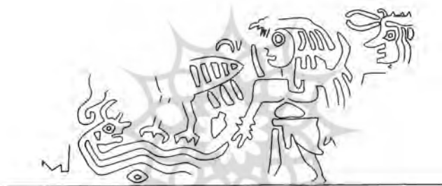
تصویر شماره‌ی یک (الف)، متعلق به کشفیات کنارصندل

با توجه به، به کاربردن شاخ و بال در این تصویر نقش‌نگاری شده، نشان می‌دهد که این دو شخصیت در روزگار خود از جایگاه ویژه‌ای چون پهلوانی، پادشاهی و یا خدایی برخوردار بوده‌اند که تصویر آن‌ها توسط صنعتگر بر روی ظروف حکاکی شده است. در خصوص تصویر صحنه‌ی حکاکی شده‌ی دیگری که مدنظر ماست (تصویر شماره یک - ب) باید گفت بر روی این مهر نیز که متعلق به فردی عالی مقام است.