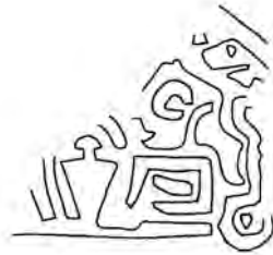
تصویر شماره‌ی ده کشفیات کنارصندل

اثر یک مهر مسطح است، یک سمت چیزی را نشان می‌دهد که می‌بایست نمونه‌ی دیگری از صحنه‌ی تقابل شخصیت‌ها باشد و آزمایش دقیق وی از نحوه‌ی شکل بخشی مردمک چشم در این مهر و چشم در مهر موزه‌ی بریتانیا امکان تولید هر دو اثر در یک کارگاه واحد را در ذهن متبادر می‌سازد. در این صحنه تقابل شخصیت‌ها، ظرفی آن‌ها را از هم جدا می‌سازد. (مجیدزاده، ۱۳۸۳: ص ۶۲)