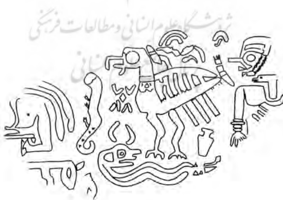
تصویر شماره‌ی دو، کشفیات کنارصندل

در این تصویر متفاوت که به جای کلاه شبیه پرنده، کلاهی پهن بر سر دارد و بر صورت او اثر زخم یا علامتی به حالت مورب است و یک پرنده‌ی شکاری از بالای شانه‌ی او نقش و نگاری شده است نمایش می‌دهد که نقش پرنده‌ی شکاری و مار کاملترین بخش بر جای مانده در این قطعه‌ی شکسته است و تنها نشان حضور زوج نشسته، بخش سالم مانده‌ی کوچکی از تصویر نشسته‌ای در سمت چپ است که (احتمالاً) مرد است. (مجیدزاده، ۱۳۸۳: ص ۵۷) را می‌توان دید که باز در این اثر روایتگری هنرمند حکاک در قالب زوج تکرار می‌شود که ما را به سمت رخداد مهم بین یک زوج هدایت می‌کند؛ گویی هنرمند حکاک راوی مجدد روایتی بسیار مهم و دارای شکوه در عصر خود شده که وی را از به تصویر کشیدن سایر زیبایی‌های محیط پیرامونش باز می‌دارد.