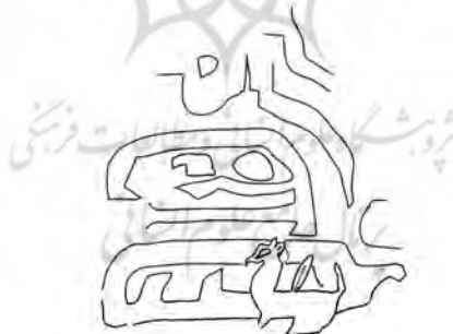
تصویر شماری پنج متعلق به کشفیات کنارصندل

احتمالا بخش بالایی بدن شخصیت مونث در تصویر مورد بحث ما در قطعه‌ی دیگری که تصویر آن را در ذیل این مطلب آورده‌ایم بر جای مانده است. این شخص که رو به سمت چپ دارد، دست‌کم از نظر سبک و قد و قواره به صحنه‌ی ترکیبی در تصویر شماری پنج شبیه است که با داشتن موهای بلند و نبودن طره‌ی موی افتاده بر شانه، سینه‌ی برآمده‌ی زنانه و نیم‌رخ زاویه‌دار صورت، گواه بر مونث بودن این شخصیت است. (مجیدزاده، ۱۳۸۳: ص ۶۱).