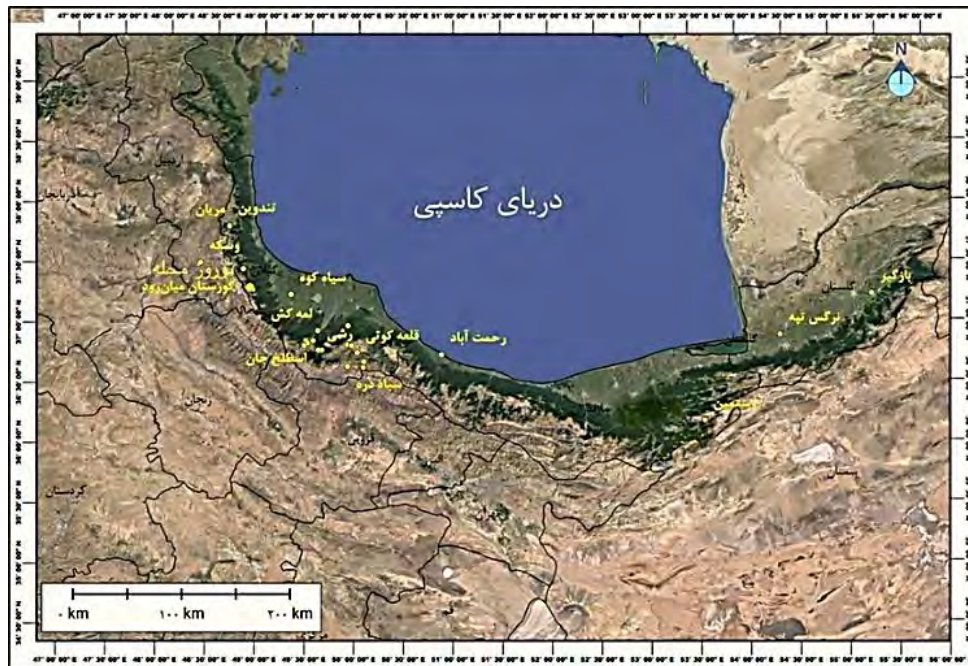
شکل ۲: موقعیت جغرافیایی محوطه‌ها و گورستان‌های دوره اشکانی در منطقه جنوبی دریای کاسپی (Author, 2023)

جدول ۲: اطلاعات مربوط به انواع ساختار قبور دوره اشکانی مکشوفه از منطقه جنوبی دریای کاسپی (Author, 2023)