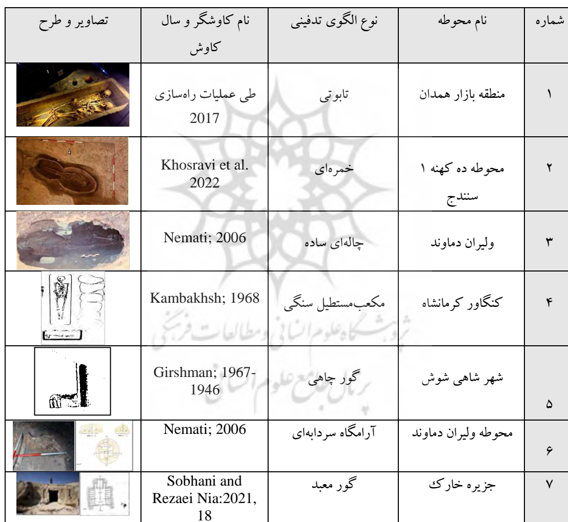
جدول ۱: نمونه‌هایی منتخب از الگوهای تدفینی دوره اشکانی (Author, 2023)

نپرداخته، همچنین فقط یک عکس با کیفیت پایین از این نوع قبور موجود است نمی‌توان به طور دقیق به تحلیل علمی در خصوص ساختار این نوع قبور پرداخت، به همین دلیل به نظر کاوشگر احترام گذاشته و این نوع قبور را به همین نام معرفی نموده‌ایم.