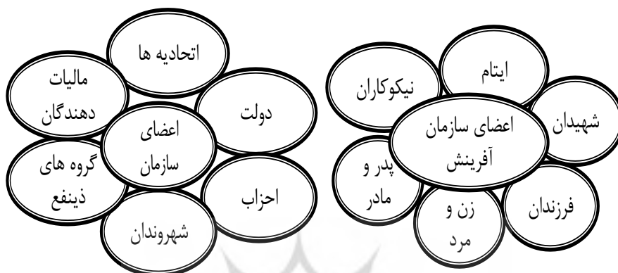
شکل ۳. تأثیرگذاران بر سازمان آفرینش و سازمان

سال تمام شیر می دهند (مکارم شیرازی، ج ۲: ۱۸۶) و شهیدان، یتیمان، خدمه، نیکوکاران، و کافران. با کمی دقت نتیجه می گیریم که این گونه افراد تأثیرگذاران در سازمانی هستند که خداوند آن را