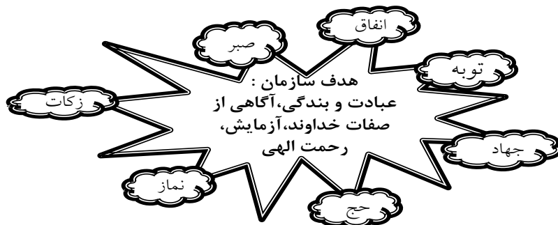
شکل ۶. مجموعه استراتژی‌های خداوند برای مدیریت جهان هستی