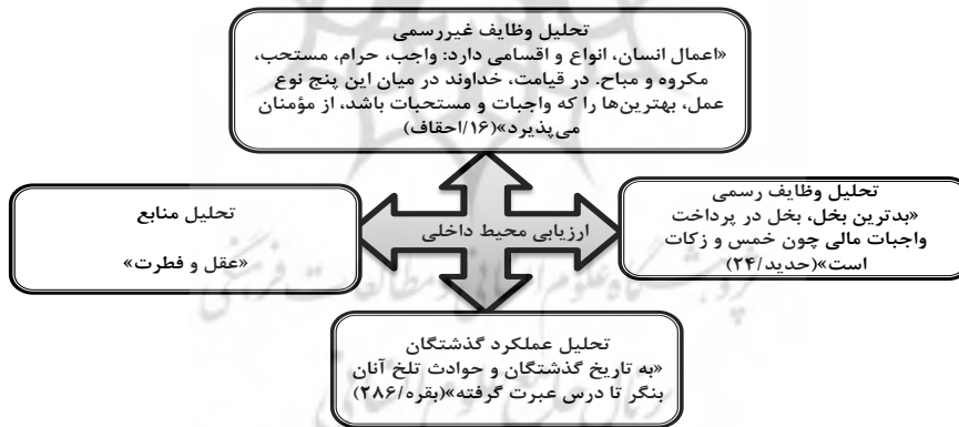
شکل ۵. ارزیابی محیط داخلی از منظر قرآن

نقاط قوت و ضعف داخلی سازمان ارزیابی می‌شود: نقاط قوت (Strengths): مجموعه منابع و توانمندی‌های داخل سازمانی است که سازمان را در جهت نیل به اهداف خود یاری می‌نماید. نقاط ضعف (Weaknesses): مجموعه‌ای از عوامل داخل سازمانی می‌باشد که مانع از تحقق اهداف سازمان می‌گردند. شکل ۵ بیانگر مرحله ارزیابی محیط داخلی از منظر قرآن می‌باشد: