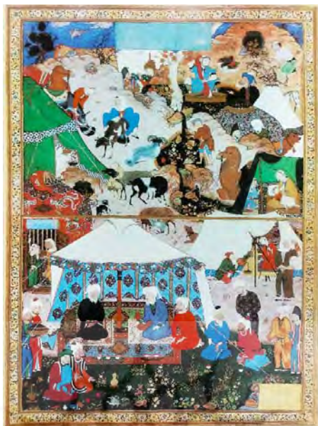
تصویر ۱. عدم تفکیک جنسیتی در زندگی مردم عامه، نگاره خیمه‌زنی بیابان‌گردان از خمسه [۱۰]