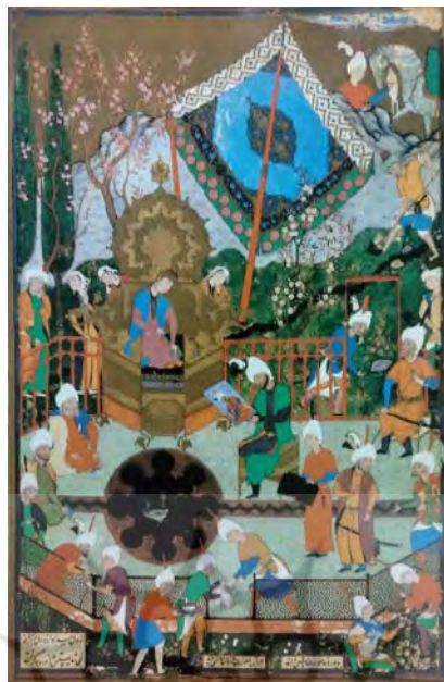
تصویر ۱۱. زن به عنوان کنشگر: نگاره شاپور تصویر خسرو را به شیرین می‌نماید از خمسه [۹]