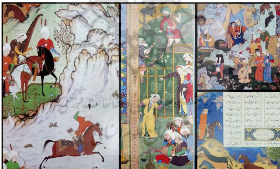
تصویر ۶. زنان در عرصه هنر و سرگرمی: تفریح، سوارکاری، رقص و نوازندگی (راست بالا: بخشی از نگاره ابلیس مرد فاسد را ملامت می‌کند از هفت‌اورنگ [۶۱، 30a]؛ راست پایین: بخشی از نگاره اسب گرفتن سهراب از شاهنامه [۵۶، Folio 141r]؛ وسط: بخشی از نگاره ازدواج سیاوش و فرنگیس از شاهنامه [۵۶، Folio 185v]؛ چپ: بخشی از نگاره بهرام‌گور در شکار از خمسه [۶۲، pl. 10])