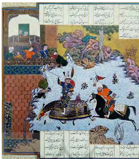
تصویر ۹. زن به‌عنوان شاهد: نگارهٔ بیژن، فرود را مجبور به فرار می‌کند از شاهنامه [۵۶، Folio 234r]