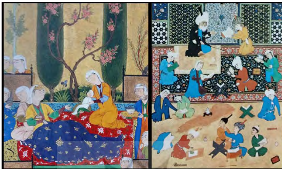
تصویر ۵. زنان در عرصه فرهنگی: تحصیل زنان و پزشکی (راست: نگاره لیلی و مجنون در مکتب درس از خمسه [۹، ص ۱۹]؛ چپ: نگاره زاده شدن زال از شاهنامه [۵۶، Folio 61v])