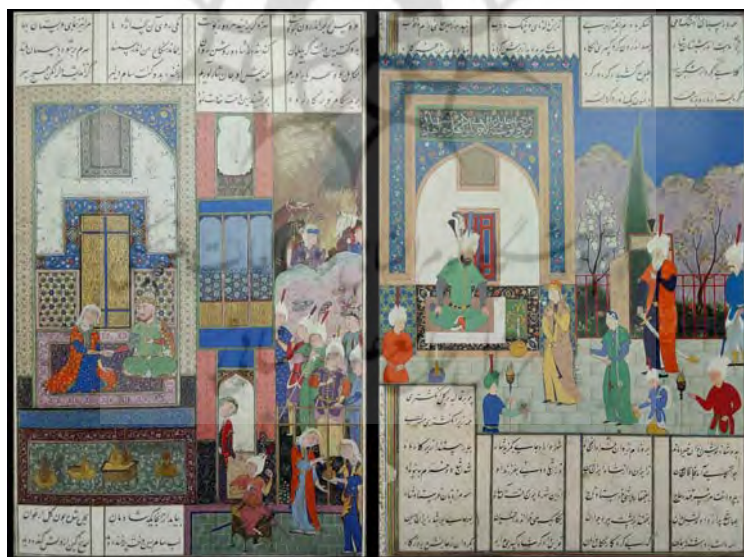
تصویر ۴. زنان در عرصه سیاسی: شفیع و سفیر (راست: نگاره درود انوشیروان به دختر خاقان از شاهنامه [۵۶، Folio 633v]; چپ: نگاره سام با سیندخت عهد می‌بندد از شاهنامه [۵۶، Folio 85v])