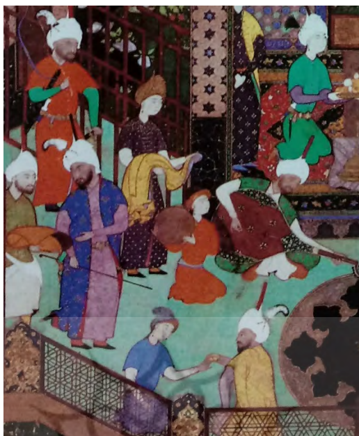
تصویر ۳. عدم تمایز جنسیتی بین برخی از افراد، بخشی از نگاره خسرو در حال گوش دادن به موسیقی یارید از خمسه [۴۱، لوح ۴۱]