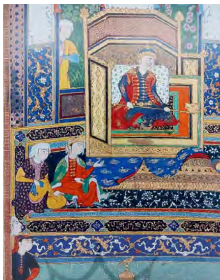
تصویر ۷. تفاوت در سربند زنان اشرافی با ندیمه‌ها، بخشی از نگاره نشستن فریدون بر تخت ضحاک از شاهنامه [۵۶، Folio 34v]