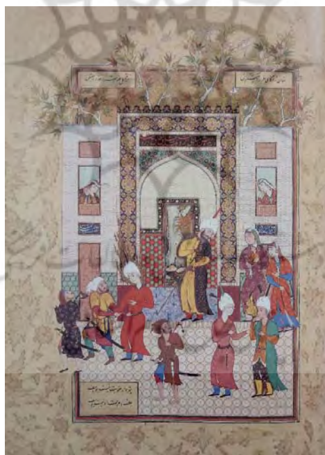
تصویر ۱۰. زن به‌عنوان شاهد و کنشگر: نگارهٔ شهادت کودک بر بی‌گناهی یوسف از هفت‌اورنگ [۶۱،