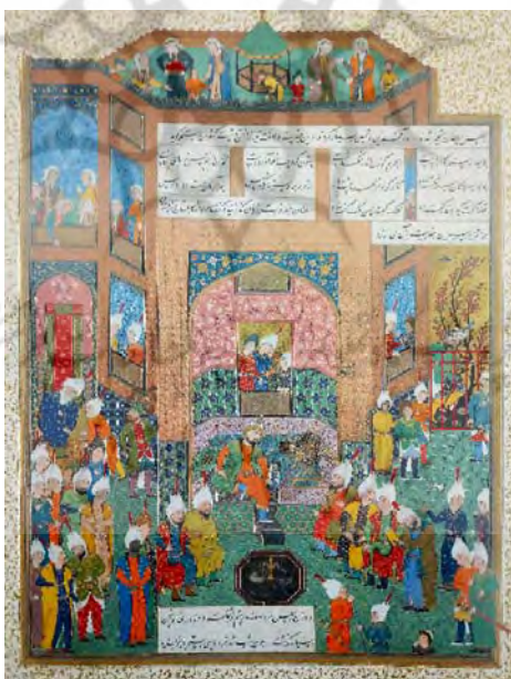
تصویر ۲. تفکیک جنسیتی در دربار، نگاره طبع آزمایی فردوسی در برابر سلطان محمود از شاهنامه [Folio 10r, ۵۶]