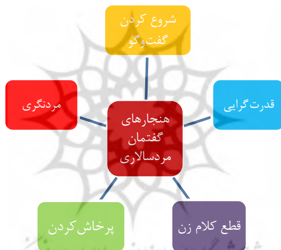
تصویر ۱. هنجارهای گفتمان زبانهنگ «مردسالاری»

۱۲. هنجارهای گفتمان: همان گونه که انتظار می‌رود، در دهه ۱۳۶۰ تفکر مردسالاری در جامعه ایرانی حاکم بوده و این نگرش در فیلم‌های آن دهه نیز به وضوح مشاهده می‌شود. با بررسی فیلم‌های دهه ۱۳۶۰ درمی‌یابیم که موقعیت‌های کاربرد عواملی مانند نوبت‌گیری، قطع کردن گفت‌وگوی طرف مقابل، صحبت کردن با صدای بلند، شروع کننده مکالمه بودن، مردسالاری، قدرت‌گرایی و مواردی از این قبیل، که بیانگر هنجارهای گفتمان‌اند، بیشتر برای مردان فراهم است و این مردان‌اند که در این گونه موارد در گفت‌وگوهای خود قدرت انتخاب بالاتری نسبت به زنان دارند و زنان بیشتر به سکوت محکوم بودند و در مقابل پرخاش‌های شوهرشان عکس‌العملی از خود نشان نمی‌دادند و عموماً تسلیم خواسته شوهر می‌شدند. این‌ها نمونه‌هایی از فرهنگ بارز آن دهه است که از طریق واکاوی زبانهنگ مردسالاری می‌توان نمایان‌شان کرد. تصویر شماره ۱ نشان‌دهنده این هنجارهای گفتمان است.