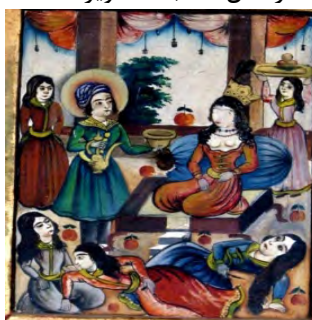
تصویر ۷. نقش یوسف و زلیخا در نقوش دیواری قلعه چالستر، طهماسبی‌زاده و دیگران، ۱۳۹۴: شکل ۳