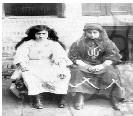
تصویر ۱۰. عکس پوشش زنان در داخل خانه دوره قاجار، عکاس نامعلوم، متعلق به مجموعه مطالعات تاریخ معاصر ایران، شماره 1261A132

به دلیل منع مذهبی و مخالفت اقشار مسلمان به عکاسی از بانوان، این بخش از عکاسی دوره قاجار همواره از کارهای پیچیده و مشکل یک عکاس به شمار می‌رفت، زیرا زنان به عکاسان مرد در حالت کشف حجاب و بدون داشتن چادر و روبنده نامحرم شمرده می‌شدند و این عمل از نظر روحانیان و مراجع مذهبی مذموم و منهی شمرده می‌شد [۲۴، ص ۱۷۱]. حاکم‌بودن فضای سنتی و مذهبی بر اجتماع دوره قاجار سبب شده بود که زنان چهره خود را چه در بیرون و چه در محیط‌های داخلی همواره از نامحرمان پوشیده نگاه دارند (تصویر ۹ و ۱۰). به همین دلیل، کمتر زنی حاضر بود به میل و اراده خود بی‌حجاب در مقابل دوربین مردان نامحرم قرار بگیرد، زیرا از آن واهمه داشت که چهره‌اش را مرد نامحرم، چه در حین عمل عکاسی و چه پس از آن در عکس کاغذی، ببیند یا عکس چهره‌اش به دست مرد نامحرم بیفتد.