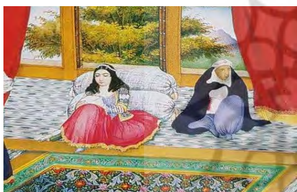
تصویر ۲. پوشش زنان قاجار در داخل خانه، برگرفته از کتاب زندگی و آثار صنایع‌الملک

ص ۴۰۴]، هینریش بروگش [۴، ص ۸۸]، کلود انه [۱، ص ۱۶۲-۱۶۴]، لیدی شیل [۲۲، ص ۶۳] و کلارا کولیور رایس [۲۸، ص ۳۴-۳۵] اشاره کرد. پوشاک زنان دوره قاجار را با توجه به همه سفرنامه‌ها این گونه می‌توان توصیف کرد: تنبان یا شلوار زنان گشادتر از شلوار مردان است و تا پای ساقین را کاملاً می‌پوشاند. پیراهن بسیار کوتاه و بدون یقه و جلوسینه باز است. از روی پیراهن نیم‌تنه‌ای به نام ارخالق، که معمولاً از اطللس آستردار است، بر تن می‌کنند و لباس رویی به نام چاپکین، جامه بی‌یقه جلوبازی است که زیر کمرگاه سه دکمه کنار هم دوخته‌اند. سرانداز زنان عبارت است از پارچه چهارگوش اغلب بردوری دوزی شده از جنس ابریشم یا نخی به نام چارقد که از زیر چانه و گلو به وسیله سنجاقی محکم می‌شود. زنان در بیرون از خانه چادر به سر می‌کنند و از سر تا پیشان را می‌پوشانند و به روی سر پارچه سفیدی می‌اندازند که در مقابل چشمان چندین شبکه دارد و با آن است که جلوی خود را می‌بینند (تصویر ۱ و ۲). فقط از دوره ناصرالدین شاه زنان لباس‌هایشان شباهت بسیاری به لباس رقاصان زنانه فرنگستان پیدا می‌کند.