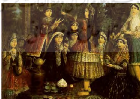
تصویر ۶. زنان درباری گرد سماور، برگرفته از کتاب Painting Persian Royal ، شماره ۸

از میان این تصاویر، بیشتر زنان را در پرده‌هایی مربوط به زنان حرمسرا مشاهده می‌کنیم. این پیکره‌ها اغلب به صورت نشسته، لمبیده، تکیه‌داده به مخده پرتزینشان، با صورت‌های بزرگ‌کرده و گونه‌های گلگون با تاج مرصع پرپری بر سر، در جامه‌های پر نقش و نگار مرواریددوزی و جواهرنشان غرق در زیورآلاتی مانند گوشواره، گردنبند، دستبند و... بسیار آرام و راحت، به دور از هر دغدغه و آشفتگی ظاهر، در حال استراحت‌اند (تصویر ۶). فضایی که این زنان در آن قرار گرفته‌اند فضایی است بسیار پرتجمل همراه اشیا و وسایل گرانبها. این پیکره‌ها معمولاً یا پیمانه‌ای خالی از شراب در دست دارند و دست راست خود را زیر سر حائل کرده‌اند یا مشغول زینت آرایش سر و موی خودند، یا گل و بادبزی در دست دارند و گاهی نیز در حال بازی با حیواناتی مانند طوطی، گربه و خرگوش به تصویر درآمده‌اند [۸، ص ۷۲-۷۳].