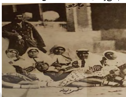
تصویر ۱۱. زنان حرمسرا، عکاس جعفرقلی خان نیرالملک هدایت، برگرفته از کتاب ناصرالدین شاه عکاس، شماره ۱۲

مرحوم استاد ذکا در کتاب تاریخ عکاسی و عکاسان پیشگام در ایران متذکر شده که تنها گروهی از زنان، که به آسانی و راحتی حاضر می‌شدند تا از آن‌ها عکس گرفته شود، نوازندگان، رقاصان و بالاخره روسپیان بودند که گاه به حالت عادی و گاه در حالت نوازندگی و رقص یا با جامه‌های مردانه در برابر دوربین قرار می‌گرفتند. به نظر می‌رسد که از همین زنان نیز باید با اجازه مراجع مذهبی عکس گرفته می‌شد تصویر (۱۳) [۲۴، ص ۱۶۸].