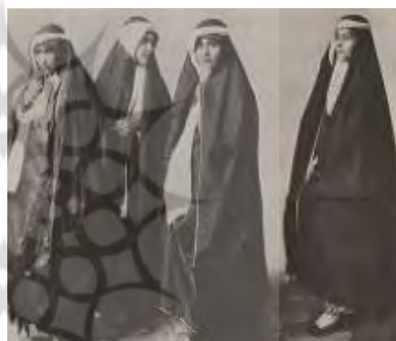
تصویر ۹. عکس پوشش زنان در بیرون خانه، عکاس نامعلوم، متعلق به مجموعه مطالعات تاریخ معاصر ایران، شماره 1261A99

پس بی‌درنگ با مشکل عکاسی از زنان در این دوره مواجه می‌شویم که مسئله‌ای اجتماعی بود. هرچند در ایران آن روز عکاسی از زنان منع قطعی نداشت، عکاسان مرد اجازه ورود به حرمسرا را نداشتند. از این رو عکاسی از زنان تقریباً ناممکن بود. با وجود این، راه‌هایی برای دورزدن این مسئله وجود داشت.