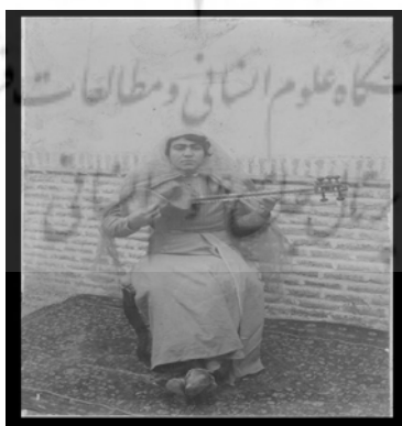
تصویر ۱۳. زن نوازنده، متعلق به مجموعه مطالعات تاریخ معاصر ایران، شماره 1267B72

مرحوم استاد ذکا در کتاب تاریخ عکاسی و عکاسان پیشگام در ایران متذکر شده که تنها گروهی از زنان، که به آسانی و راحتی حاضر می‌شدند تا از آن‌ها عکس گرفته شود، نوازندگان، رقاصان و بالاخره روسپیان بودند که گاه به حالت عادی و گاه در حالت نوازندگی و رقص یا با جامه‌های مردانه در برابر دوربین قرار می‌گرفتند. به نظر می‌رسد که از همین زنان نیز باید با اجازه مراجع مذهبی عکس گرفته می‌شد تصویر (۱۳) [۲۴، ص ۱۶۸].