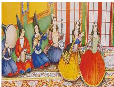
تصویر ۴. نقش زن نوازنده در حال اجرای برنامه در دوره قاجار، برگرفته از کتاب زندگی و آثار صنایع‌الملک

از میان این تصاویر، بیشتر زنان را در پرده‌هایی مربوط به زنان حرمسرا مشاهده می‌کنیم. این پیکره‌ها اغلب به صورت نشسته، لمبیده، تکیه‌داده به مخده پرتزینشان، با صورت‌های بزرگ‌کرده و گونه‌های گلگون با تاج مرصع پرپری بر سر، در جامه‌های پر نقش و نگار مرواریددوزی و جواهرنشان غرق در زیورآلاتی مانند گوشواره، گردنبند، دستبند و... بسیار آرام و راحت، به دور از هر دغدغه و آشفتگی ظاهر، در حال استراحت‌اند (تصویر ۶). فضایی که این زنان در آن قرار گرفته‌اند فضایی است بسیار پرتجمل همراه اشیا و وسایل گرانبها. این پیکره‌ها معمولاً یا پیمانه‌ای خالی از شراب در دست دارند و دست راست خود را زیر سر حائل کرده‌اند یا مشغول زینت آرایش سر و موی خودند، یا گل و بادبزی در دست دارند و گاهی نیز در حال بازی با حیواناتی مانند طوطی، گربه و خرگوش به تصویر درآمده‌اند [۸، ص ۷۲-۷۳].