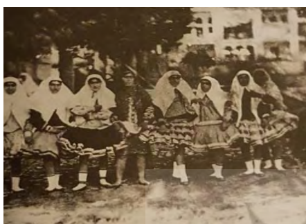
تصویر ۱۲. زنان حرمسرا در نیاوران، عکاس ناصرالدین شاه، برگرفته از کتاب ناصرالدین شاه عکاس، شماره ۱۳

مثلاً نخستین عکس‌های ناصرالدین شاه بیشتر از زنان حرمسرا و غلام‌بچه‌ها و ساختمان‌های قصر سلطنتی و اندرون حرمسرای شاهی است و اولین دستیار او در کار عکاسی جعفرقلی خان نیرالملک هدایت است که با توجه به نسبت محرمیتی که با شاه داشته، اجازه عکس‌برداری در حرمسرای شاه و زنان او را نیز می‌یابد و کار ظهور و چاپ عکس‌ها را نیز وی به انجام می‌رسانیده است [۲۵، ص ۲۶].