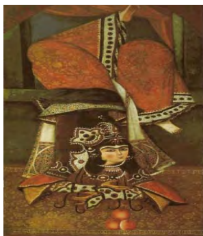
تصویر ۵. زن آکروبات‌باز، برگرفته از کتاب Painting Persian Royal ، شماره ۷

ساعد و بندبازی با تأکید بر ریتم و حرکت از دیگر موضوعات مورد علاقه نقاشان به شمار می‌رفتند (تصویر ۵) [۹، ص ۳۳].