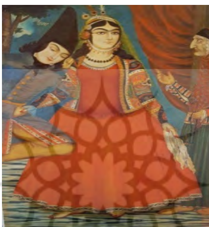
تصویر ۳. زیورآلات زن در دوره قاجار، برگرفته از کتاب زندگی و آثار صنایع‌الملک

خاصی دارد و دست و پایشان نیز ظریف و زیباست جاذبه خاصی می‌بخشد. خانم‌های متخصص و از خانواده‌های برجسته، اغلب تاج الماس گرانبهایی بر سر می‌گذارند. دکتر ویلز [۳۴، ص ۳۶۵-۳۶۶] اذعان دارد که کلیه زنان ایرانی، از هر قشری که هستند، علاقه زیادی به استفاده از طلا و جواهر به‌عنوان زینت‌آلات از خود نشان می‌دهند. زینت‌آلات نقره‌ای مخصوص قشر محروم و کم‌بضاعت، اغلب به صورت دستبند و انگشتری‌های نقره به کار می‌رود. بازوبند ساخته‌شده از طلا و جواهر نیز، که دعا یا طلسمی را در خود دارد، به بازوی خانم‌های ثروتمند بسته می‌شود (تصویر ۳).