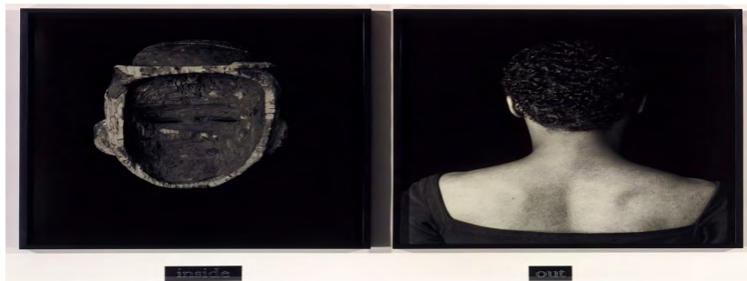
تصویر ۵. نقطه قوت، ۱۹۹۱، ۸۶ در ۱۱۰ سانتی‌متر، موزه هنر کارولینای شمالی [۲۴]

از سوئی در ابتدای هر ده واژه، جناس پیشوند mis با miss می‌تواند عبارت‌هایی همچون تعریف زن، شناخت زن، هویت زن و... را در ذهن زنده کند که ارتباط این سوگیری‌ها با زنانگی را به یاد می‌آورد.