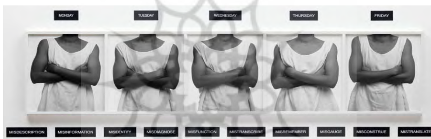
تصویر ۴. برآورد پنج‌روزه، ۱۹۹۱، ۶۱ در ۳۰۳ سانتی‌متر، گالری تیت لندن [۲۴]

برآورد پنج‌روزه ۲ (۱۹۹۱) نیز یک زن جوان رنگین‌پوست را این بار از روبه‌رو، اما بدون سر، در پنج لته تصویر می‌کند (تصویر ۴). بهره‌ی سیمپسون از تکنیک سیاه و سفید یادآور تصاویر مردم‌نگارانه یک سده قبل است که شخصیت‌های آن‌ها نماینده یک قوم با پوشاک و آیین و ساختار بدنی ویژه بود. در اصل، شخصیت‌های بدون سیمای شخصی سیمپسون نیز چنین‌اند و فردیتشان برای بیننده غیرقابل دسترسی است.