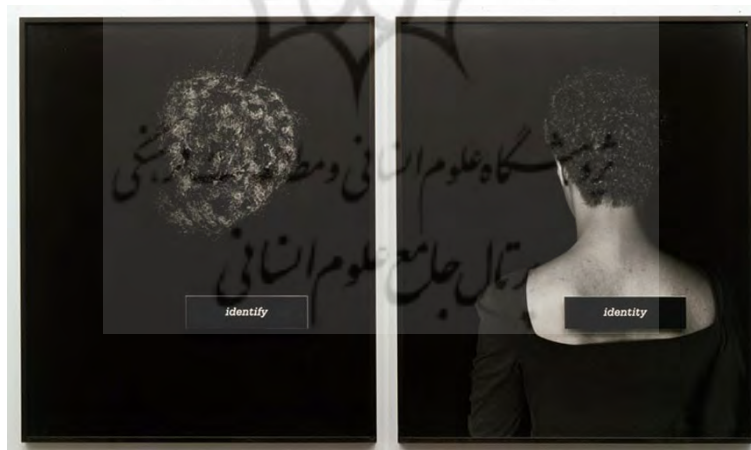
تصویر ۳. هویت، ۱۹۹۰، ۱۲۴ در ۲۱۳ سانتی‌متر، موزه هنرهای معاصر بوستون [۲۴]