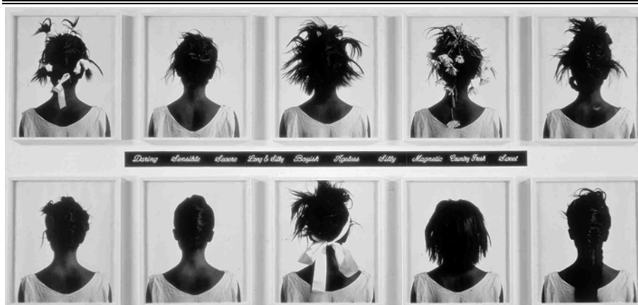
تصویر ۱. مدل‌های کلیشه‌ای، ۱۹۸۸، ۱۶۷ در ۲۹۴ سانتی‌متر، مجموعه خصوصی [۲۴]

مدل‌های کلیشه‌ای ۱ (۱۹۸۸) مجموعه‌ای از ده عکس فوری سیاه و سفید است که با دوربین پولاروید گرفته و پس از چاپ روی صفحات پلاستیکی چسبانده شده‌اند (تصویر ۱). هر ده عکس سر و شانه‌های یک زن سیاه‌پوست را از پشت تصویر می‌کنند؛ درحالی‌که در هر یک از عکس‌ها مدل موی متفاوتی دارد.