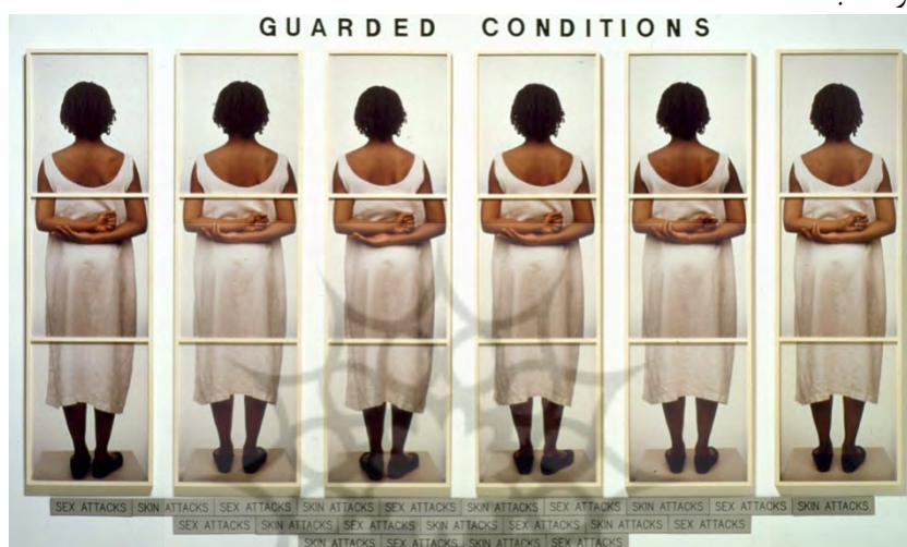
تصویر ۲. وضعیت دفاعی، ۱۹۸۹، ۲۳۱ در ۳۳۲ سانتی‌متر، موزه هنر معاصر سان‌دیگو [۲۴]

محور بار معنایی این اثر ۲۱ عبارت نوشته‌شده زیر عکس‌هاست. حمله به جنسیت یازده بار تکرار شده و حمله به رنگ پوست ده بار. این نوشته‌ها همچون آجرهایی برهم چیده شده‌اند تا برای شخصیت بی‌چهره دیوار ناستواری از رنج بسازند که می‌تواند نماینده همه بانوان سیاه‌پوست باشد.