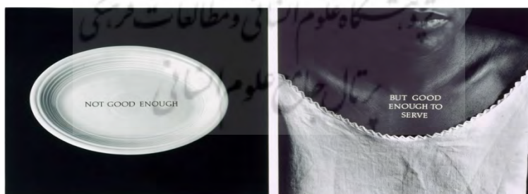
تصویر ۶. جیره نوع سوم، ۱۹۹۱، ۶۳ در ۱۲۲ سانتی‌متر، مجموعه خصوصی [۲۴]

نقطه قوت ۱ (۱۹۹۱) اثری است که این بار بانوی ناشناس رنگین‌پوست را در کنار یک سیمایه اجدادی افریقایی تصویری کرده. زن باز هم پشت به بیننده دارد. ماسک نیز برگردانده شده و رویه‌اش دیده نمی‌شود که در این حالت مفهوم آیینی و قدرت جادویی‌اش را از دست می‌دهد. این‌همانی زن با سیمایه نیاکانی در این اثر می‌تواند اشاره‌ای به ریشه‌های باستانی شهروندان افریقایی-امریکایی باشد. دو واژه زیر عکس‌ها در کنار هم عبارت «پشت و رو» را می‌سازند، اما اگر جدا دیده شوند، می‌توان ماسک اجدادی را هم‌ارز درون (پیوند با فرهنگ و میراث کهن، خود درونی و هویت راستین) و تصویر زن را هم‌ارز بیرون (تجربه زیسته بانوی رنگین‌پوست، پوسته بیرونی بدن و هویت تحمیلی) دانست. بدین‌سان سیمایه، در نقش ریشه فرهنگی، برای زن به یک نقطه قوت و تکیه‌گاه بدل می‌شود. ناتوانی مخاطب در دیدن این هر دو، آشکارکننده نابسندگی آگاهی ما در فهم پیشینه تاریخی/ فرهنگی دیگر انسان‌هاست.