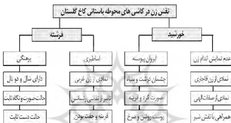
تصویر ۸. ویژگی نقش زن در قالب خورشید و فرشته، محوطه باستانی کاخ گلستان

موجودی فرازمینی و اساطیری تبدیل کرده است. تنها در یک قاب از کاشی‌ها شاهد تصویر زن با تناسبات و ویژگی انسان زمینی و غیراساطیری هستیم که در آن دو زن در چمن‌زار را نشان می‌دهد که در این قاب نیز نوع پوشش و ترسیم چهره دو زن همچنان تحت تأثیر هنر غرب و یادآور کارت‌پستال‌های اروپایی است. به‌طور کلی، می‌توان تصویر زن در خورشید را نمادی از زن شرقی و تصویر فرشته را نمادی از زن غربی دانست و این تلفیق هنر غرب و سنتی می‌تواند گواهی بر شرایط جامعه و دوگانگی‌های اجتماعی در پی ارتباطات میان غرب و ایران باشد که همچون کتابی مصور تاریخ قاجار را بازگو می‌کند.