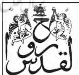
تصویر ۴. سرلوح روزنامه روح‌القدس [۲، ص ۱۳۷]. تصویر ۵. سرلوح روزنامه علمی [۱۵، ص ۹۸]