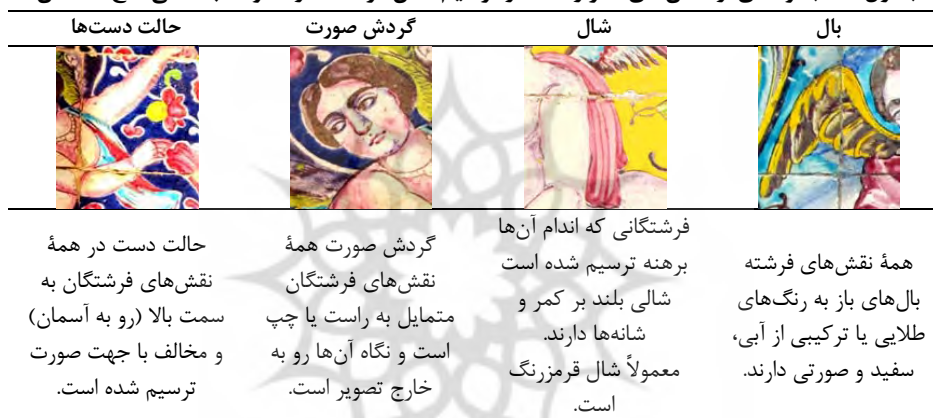
جدول ۴. مجموعه‌ای از المان‌های تکرار شده در ترسیم نقش فرشته، در محوطه باستانی کاخ گلستان

در بررسی تصویر زن در قالب فرشته، هشت نمونه از این فرشتگان بالدار بر چهار قاب از کاشی‌های محوطه باستانی کاخ گلستان و به صورت قرینه قابل مشاهده است. فقط دو نمونه از این فرشته‌ها پوشش دارند و دیگر نقش‌های فرشته به صورت برهنه و با شالی بر کمر ترسیم شده‌اند که با رنگ‌های ملایم و متمایل به صورتی و نزدیک به شمایل واقع‌گرایانه انسانی نقاشی شده‌اند. در جدول ۴، ویژگی‌های ثابت و تکرار شده در نقش‌های فرشته‌ها نشان داده شده است. رنگ‌بندی، نوع پوشش و حالات پیکره‌ها در کنار یکدیگر و استفاده از نماد بال، تصویر را به شخصیتی فرازمینی تبدیل کرده است. در همه نقش‌های موجود از فرشته، عنصر بال به صورت ثابت تکرار شده است و همچنین حالت صورت و دست‌ها نیز کاملاً مشابه با یکدیگر ترسیم شده‌اند. نوع طراحی چهره و اندام در برخی از فریم‌ها یادآور شخصیتی از یک کودک است و در برخی از نمونه‌ها تناسب یک انسان بالغ و فربه را دارد. چهره و گردش صورت به حالت سه‌رخ است و حالت چشم‌ها همچنان تصویری از زن شرقی و قاجاری را تداعی می‌کند. همه فرشتگان در پس‌زمینه‌ای عرفانی از گل یا آسمان قرار گرفته‌اند که حالت پرواز و رفتن به اوج را تداعی می‌کند.