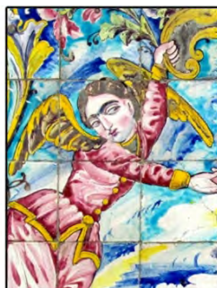
تصویر ۷. نقش اساطیری فرشته در کاشی‌های محوطه باستانی کاخ گلستان