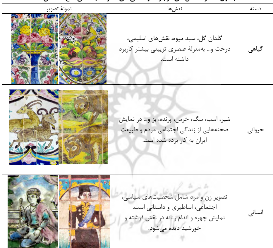
جدول ۱. نمونه نقش‌های موجود در کاشی‌های محوطه باستانی کاخ گلستان

مذهبی و ملی بودند [۱، ص ۳۰۰]. در مجموعه کاشی‌های محوطه باستانی کاخ گلستان نیز شاهد نقش‌های متنوعی از این گروه همچون نقش‌های گیاهی، جانوری، انسانی و هندسی هستیم که نقش‌های هندسی، اسلیمی و پیچک‌ها در کنار نقش گلدان‌های گل و سبدهای میوه، فرشتگان و اساطیر یا پرندگان مشاهده می‌شوند. موضوع انسان و شیوه ترسیم شخصیت‌ها بیش از دیگر نقش‌ها چشم بیننده را به خود جلب می‌کند. در جدول ۱، نمونه نقش‌های استفاده‌شده در محوطه باستانی مجموعه معرفی شده است.