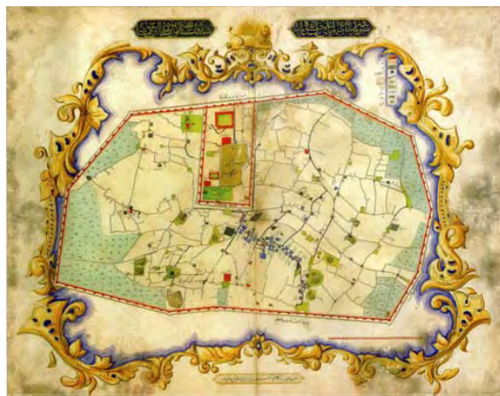
تصویر ۱. تصویری از بنای اولیه کاخ گلستان [۲۸]