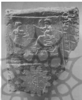
تصویر ۶. قطعه‌ای از لوح، اثر مهر تن‌اولی [۱۷، ص ۲۸۹]

که هاله تقدس او را فرا گرفته است و در آثار هنری گاه به نقش زن و گاه به نماد مار بازنمایی شده است. در نظام سیاسی ایلام باستان، زن یا ملکه حافظ دودمان شاهی است و همواره عنصر ثابت است که خود را در قالب نقش مار چنبره‌زده زیر تخت پادشاه (تصویر ۶)، که تخت شاهی را حفظ کرده است، نشان داده است. پوست‌اندازی مار نماد پادشاهانی است که یکی بعد از دیگری روی کار می‌آیند و باعث پایداری و جاودانگی تخت شاهی می‌شوند. از این‌رو، ایلامیان اصالت خون را از طرف زن می‌دانستند. در این فرهنگ، که افراد به مادر و تبار مادری منسوب می‌شود، عموماً، و نه همیشه، زنان موقعیت اجتماعی برتری داشتند؛ اما قدرت لزوماً در دست آنان نبود [۳۵، ص ۱۷۵].