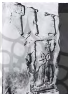
تصویر ۱. نقش زنی که مار یا جریان‌های آب در دست دارد، سنگ یادمان اونتاش‌گل در ارگ شوش [۳۹، ص ۹۲]

آنچه می‌تواند ما را به شناخت نظام فلسفی ایلام باستان رهنمود کند، آثار هنری و درواقع عینیت‌هایی ۱ است که ما را به آشکارسازی ذهنیت‌ها ۲ هدایت می‌کند. در آثار هنری ایلام باستان، سه نقش آب، زن و مار به کرات تصویر شده‌اند. از جمله آن‌ها، نقش آب در مراسم آیینی نقش‌برجسته کورانگون و دیگر مهری از دوران ایلام میانه (تصویر ۱) است [۱۸، ص ۴۸]. در این تصویر، نقش زنی که جریان‌های آب را در دست دارد و جریان آب پیرامون او را فراگرفته، بازنمایی شده است [۴۴، ص ۱۶۱]، برخی معتقدند که این‌ها جریان آب نیستند، بلکه تصویر مارند [۳۵، ص ۶۸].