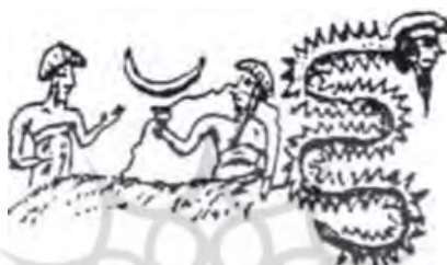
تصویر ۴. مهر با نقش مار با سر انسان از ایلام باستان [۵۰، ص ۴۸]

با توجه به مطالب پیش گفته، روشن می‌شود آب، زن و مار، هر سه، با باروری مرتبط بودند و جنبه برکت‌بخشی داشتند. بنابراین، این سه عنصر، یعنی آب، زن و مار، در اعتقادات ایلام مقدس شمرده می‌شدند. اتو ۱ موجود مقدس را دارای سه ویژگی می‌داند: ۱. هیبت داشته باشد. البته این هیبت، پنداشت ذهن انسان بود. ۲. جذاب باشد؛ به طوری که افراد بسیاری به سوی او کشیده شوند. ۳. ترس‌آور باشد؛ پیروان پدیده‌های مقدس همیشه با حالتی از ترس رفتار خود را کنترل و سعی می‌کردند از انجام دادن رفتار نادرست، که باعث خشم پدیده مقدس می‌شد، ممانعت کنند. این ترس ناشی از اخلاص همراه با احترام بود [۶۷، ص ۶-۱۱].