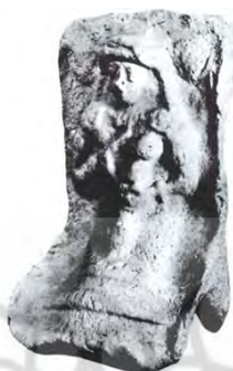
تصویر ۲. الهه مادر، ایلام باستان، هزاره دوم پ.م [۳۹، ص ۲۸]

سمبل‌های باروری شکل گرفته که زن نمونه بارز آن بوده است [۱۴، ص ۴۴۶]. در جنوب غرب ایران، در محوطه‌هایی چون چغامیش، از هزاره ششم پ.م پیکرک‌های برهنه زن یافت شده است [۵۲، ص ۴]. در تمدن ایلام، بسیاری از پیکرک‌های ساخته‌شده الهه برهنه در هزاره دوم پ.م (تصویر ۲) و مجسمه‌های زنان نیایشگر در ادوار بعد، به‌منظور ارج‌گذاری به مقام زن ساخته شده‌اند [۴۴، ص ۱۲۳-۱۲۹].