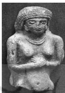
تصویر ۷. الههٔ برهنه در ایلام باستان [۵۲، ص ۹۰]

این الهه‌ها فرمانروایان اصلی قلمرو خدایان ایلامی بوده‌اند. آن‌ها به تدریج و ناخواسته (احتمالاً در طول هزارهٔ دوم پیش از میلاد) جای خود را به خدایان مرد واگذار کردند؛ با این حال، هرگز مقام رفیع خود را در سلسله‌مراتب خدایان از دست ندادند. این خدایان مطمئناً در قلب‌های مردم جای مطلوبی را برای خود حفظ کرده بودند. وجود پیکره‌های بی‌شمار گلی، که به «الههٔ برهنه» معروف‌اند، بر همین امر دلالت می‌کند [۴۴، ص ۵۲].