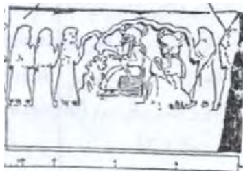
تصویر ۳. نقش مار چنبره زده زیر تخت پادشاه و مراسم آبریزان در نقش برجسته کورانگون از دوران ایلام جدید [۴۴، ص ۲۸]