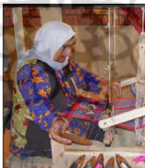
شکل ۹. پوشاک سنتی زنان لر خوزستان

«زیرجومه»: تن‌پوشی گشاد و راحت که یقه گرد با آستین‌های کوتاه دارد و لبه‌های آن با نوارهای رنگی تزئین می‌شود. «جومه»: تن‌پوشی بلند از جنس مخمل با یقه هفت و دو چاک از طرفین آن در قسمت کمر به پایین که لبه‌هایش با نوار رنگی و سکه تزئین می‌شود. «جلیقه»: تن‌پوش بی‌آستین با دو جیب از جنس مخمل با تزئینات است.