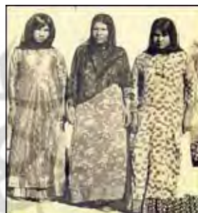
شکل ۱. لباس سنتی زنان بوشهر

به‌طور کلی، پوشاک زنان در این استان متشکل از پیراهن بلند دورچین، شلوار چیت و کفش صندل و در مجامع عمومی‌تر همراه عبای سیاه یا چادر محلی، مقنعه نازک و سیاه و روبنده نازک است. پیراهن رسمی‌تر زنان بوشهر جامه گشادی است که به آن پیراهن عربی می‌گویند و تزئین شده است. انواع پوشاک سنتی دشتستانی را می‌توان چنین توصیف کرد: