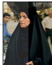
شکل ۸. سرجامه و تن‌جامه سنتی زنان عرب خوزستان