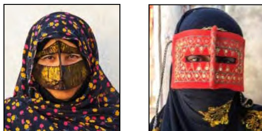
شکل ۴. برقع سرخ یا بلوچی و برقع شیله‌ای