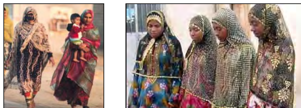
شکل ۳. سرجامه‌های سنتی زنان بندر

«چادر بندری»: چادر رنگ‌ها و طرح‌های گوناگون دارد. نوعروسان از چادر گل ابریشمی سبز استفاده می‌کنند که حاشیه زیبایی دارد و پشت آن با «اشرمه» ۱ تزئین می‌شود. عروس و نوعروسان از چادر ساده سبزرنگ با تزئینات خوس و گلابتون و پولک بوتهدوزی نیز استفاده می‌کنند. در پوشاک بانوان هرمزگان، ملحقاتی وجود دارد که علاوه بر وجه تزئینی، جنبه کاربردی نیز دارد و نقاب یکی از ملحقات مهم است.