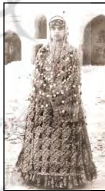
شکل ۲. پوشاک سنتی زنان دشتستان