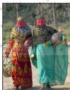
شکل ۵. تن جامه سنتی زنان هرمزگان

«پیراهن کمرچین»: کمرچین یا دورچین پیراهنی است که در بندرعباس و شهرهای اطراف آن چون میناب و رودان رواج دارد. بالاتنه در آن ساده با یقه گرد یا هفت است. آستین‌ها دوتکه و شامل تکه‌آستین و سرآستین‌ها (مچ) است. دامن این پیراهن دوتکه است و هر تکه دو برابر تکه قبلی انتخاب شده و با چین‌های منظمی به یکدیگر وصل می‌شود و دو جیب دارد. قد دامن تا بالای زانو است. بعضی از درزهای آن با نوار تزئین می‌شود.