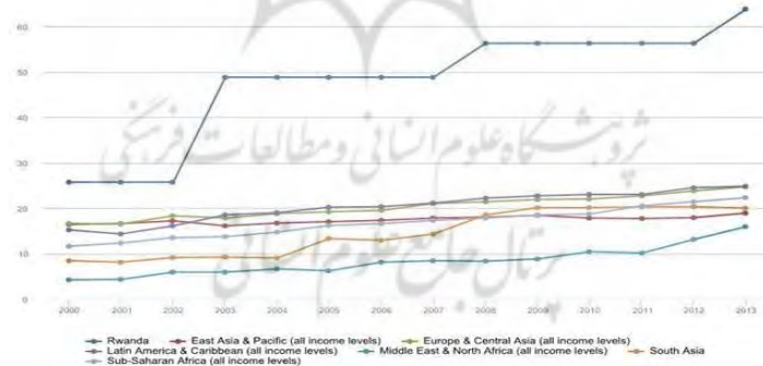
نمودار ۱. حضور زنان در پارلمان‌ها در کشورهای مختلف جهان (۲۰۱۴)

طبق آخرین داده‌های اتحادیه بین‌المجالس، کشورهای توسعه‌نیافته از لحاظ میزان مشارکت نمایندگان زن در مجلس ملی صدرنشین کشورهای دنیا هستند. در سال ۲۰۱۴، ۶۴ درصد کرسی‌های مجلس رواندا در اختیار زنان قرار گرفته است. تا سه دهه گذشته، در سطح جهانی، متوسط زنان فقط ۵ درصد مجالس را تشکیل می‌دادند. این آمار در ده سال اخیر به حدود ۲۰ درصد رسیده است. در این رشد، ایران نقش چندانی نداشته و نمایندگان زن مجلس با حضور ۳ درصدی در پارلمان، ایران را در رتبه ۱۳۷ بین ۱۹۰ کشور جهان قرار داده‌اند. از نظر این مقیاس، ایران در رتبه پایین‌تری از همسایگان خود مانند افغانستان (با رتبه ۴۲ و حضور ۲۸ درصد زنان)، پاکستان و عراق (با ۲۷ درصد و رتبه ۴۶)، ترکمنستان (با ۲۶ درصد و رتبه ۴۸) و ترکیه (با ۱۸ درصد و رتبه ۸۲) قرار دارند. اگرچه وضعیت مشارکت زنان در سیاست و اقتصاد و حضور در پارلمان‌های ملی، در سطح جهانی در حال افزایش است، هنوز راه طولانی تا برابری جنسیتی در این زمینه‌ها مانده است [۹]. نمودار ۱ روند رشد حضور زنان در پارلمان را در فاصله سال‌های ۲۰۰۰ تا ۲۰۱۳ در مناطق مختلف جهان نشان می‌دهد.