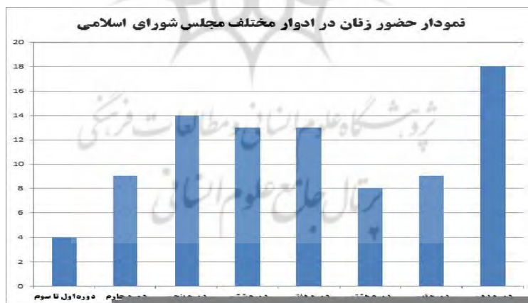
نمودار ۲. حضور زنان در ادوار مختلف مجلس شورای اسلامی

همان‌طور که ملاحظه می‌شود، در سه دوره اول انتخابات مجلس شورای اسلامی، به‌طور میانگین فقط ۱/۵ درصد نمایندگان مجلس از بین زنان انتخاب شده‌اند. دوره چهارم، پنجم و ششم و هفتم تعداد نمایندگان زن سیر صعودی داشته و به حدود ۴/۵ درصد رسیده است. این نسبت در دوره هشتم و نهم کاهش یافته است. دوره دهم دوره‌ای است که رکورد حضور زنان در پارلمان شکسته شده است (۷/۹۶). ورود ۱۸ زن به پارلمان از بین ۲۹۰ کرسی، اگرچه فقط ۸ درصد کرسی‌های مجلس شورای اسلامی را شامل می‌شود، رکوردی در تاریخ ده دوره مجلس محسوب می‌شود [۹]. نمودار ۲ حضور زنان در ادوار نمایندگی مجلس شورای اسلامی را نشان می‌دهد.