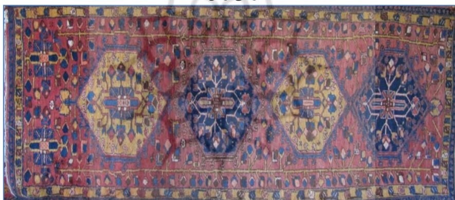
قالب ۲. قالی طرح گؤل با نقوش ریز شاخه

وقتی از هنرمندان و همه اعضای جامعه خواسته می‌شود تا درباره نقوش و طرح‌های دست‌بافته‌ها سخن بگویند، صرفاً به نام‌بردن برخی از آن‌ها بسنده می‌کنند و هیچ توضیح دیگری در خصوص چرایی وارد کردن این عناصر ویژه به داخل دست‌بافته‌ها نمی‌دهند. گویی که هدف آن‌ها صرفاً پدید آوردن فرم بوده است و نه توضیح آن؛ گویی که در لومه- دره به قول گیرتز [۲۳] «هنر نباید معنا دهد، بلکه باید حضور داشته باشد». با وجود این، واکنش‌های کلامی و جسمانی به دست‌بافته‌ها دارند که در پس خود بیشتر توضیحات حسی به اتنوگراف منتقل می‌کنند. از این نظر، نمی‌توان یک روایت یا نظامی از معانی مشخص با ارجاعات تصویری