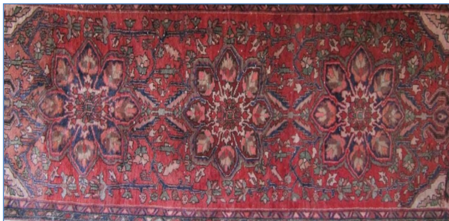
قالب ۱. قالی، طرح گؤل با نقوش ریز انواع گل و نقش مایه‌های بزرگ گل سرخ