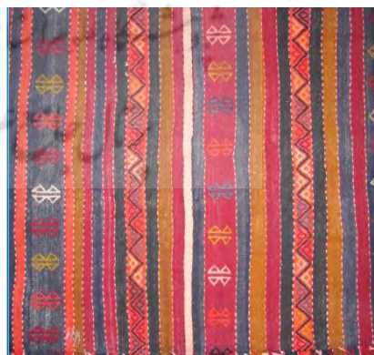
قاب ۳. جاجیم‌هایی با طرح‌های راه‌راه رنگارنگ