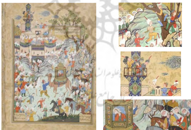
تصویر ۷. ورود عزیز مصر و زلیخا به پایتخت و استقبال مردم از آن‌ها، هفت‌اورنگ جامی، منسوب به شیخ محمد، ۹۶۳-۹۷۲، اندازه ۱۹/۵۰×۲۹/۱۰، گالری فریر، واشنگتن [مأخذ: ۱، ص ۲۰۷]

شیخ محمد در تصویر بعد، لحظه ورود زلیخا به مصر را به نمایش گذاشته است. در این نگاره، کجاوه شتری خرمایی‌رنگ در مرکز تصویر دیده می‌شود که زلیخا درون آن با لباسی قرمز ترسیم شده است. اسب سفید عزیز مصر نیز روبه‌روی شتر قرار گرفته و به‌خوبی در تصویر دیده می‌شود. پشت سر عزیز مصر خدمه‌ها طبق‌های سکه را در دست دارند و به پیشواز آمده‌اند. در بالای نگاره نیز، برج و باروی مصر دیده می‌شود و در پشت دیوارهای شهر، گنبد و مناره مسجد را می‌توان دید. زنان شهری از پشت باروهای شهر نظاره‌گر صحنه‌اند و با پوشیه‌هایی روی صورتشان را پوشانده‌اند. همچنین، زنان همراه و ندیمه‌های زلیخا نیز روینده‌هایی دارند که بخشی از چهره آنان را پوشانده است. به جز زلیخا و ندیمه‌هایش، همچنان شاهد حضور زنان درباری در پشت‌بام‌ها و آن‌سوی پنجره‌ها هستیم. در این نگاره نیز، مانند تصویر ۵ از شاهنامه، کودکان شهری از مناره مسجد، که محل مکتب‌خانه آن‌هاست، بالا رفته‌اند تا تماشاگران کوچک این ماجرا باشند و بعضی از آن‌ها از شهر خارج شده و آزادانه از بالای درخت به صحنه ورود مهمانان می‌نگرند. بعضی از آن‌ها کوچک‌ترند و از کلاه‌های نمدی ساده با لبه‌های برگشته استفاده کرده و تعدادی دیگر، شبیه بزرگ‌ترها، کلاه قزلباش دوازده‌ترک با میله قرمز رنگ میانی بر سر گذاشته‌اند. در مجموع، حضور آزادانه آن‌ها در این مراسم شادی، نمایانگر امنیت اجتماعی آن‌ها در این دوره است (تصویر ۷).