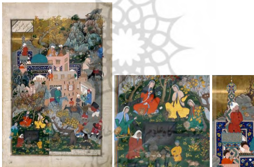
تصویر ۵. هفتواد و کرم، شاهنامه طهماسبی، منسوب به دوست محمد، مکتب تبریز، ۹۲۸-۹۴۷، موزه

و نخ بیشتری رسید. هر روز به کرم سیب می‌داد و شروع به رشتن می‌کرد تا پدرش را ثروتمند کرد... دوست محمد در این نگاره تصویر بیرون برج و باروی شهری را نشان داده است که دو پسر بچه بر پشت بام مسجد، که مکان مکتب‌خانه آنان است، نیز دیده می‌شوند. در قسمت تحتانی سمت چپ نگاره، در جمع زنانی که نخ‌ریسی می‌کنند، دختر هفتواد با لباس قرمز رنگ، درحالی که سیبی در دست دارد، ترسیم شده است. در کنار دختران، زنی در حال آماده‌کردن غذا دیده می‌شود. زن خدمتکار و پسرش هر دو پوست‌هایی به رنگ تیره دارند. همان‌طور که آمد، اختلاف طبقات اجتماعی زنان و کودکان در دوران شاه طهماسب صفوی را می‌توان از بررسی نگاره‌ها فهمید، زیرا درحالی که زنان و کودکان دربار و اشراف حتی اجازه خروج از اندرونی کاخ‌ها را نداشتند، زنان و دختران طبقات پایین در شهر و روستا آزادانه رفت‌وآمد می‌کردند و در امور اقتصادی مشارکت داشتند و زمانی که کودکان طبقات مرفه و شهرنشین در مکتب‌خانه‌ها تحصیل می‌کردند، کودکان فقیر، غلامان، و خدمه در کنار مادر یا پدر مشغول خدمت‌رسانی بودند (تصویر ۵).