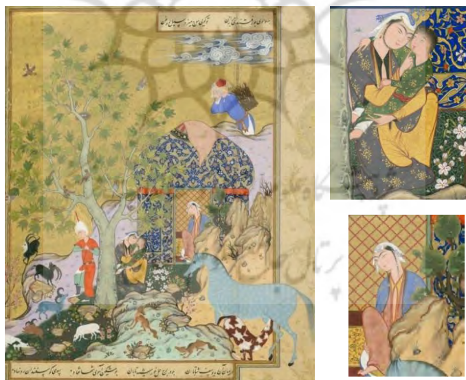
تصویر ۸. یوسف از گله‌اش حراست می‌کند، هفت‌اورنگ جامی، مکتب مشهد، ۹۶۴-۹۷۳، اندازه ۲۱/۳×۱۶/۱، گالری فریر، واشنگتن [مأخذ: ۱۴، ص ۲۱۱]

داستان یوسف و زلیخا به احسن القصص شهرت دارد. پس از ورود حضرت یوسف به خانه عزیز مصر، ابتدا زلیخا، چون مادری دلسوز، به مراقبت از او همت گمارد. حضرت که قرار است هدایت انسان‌ها را برعهده بگیرد، سرآغاز این آزمایش را در چوپانی می‌داند و به این کار مشغول می‌شود. زلیخا نیز با او به صحرا می‌رود. در این صحنه، که منسوب به مظفرعلی است، این حس مادری در چهار شکل به تصویر کشیده شده؛ اول در نقش مادری که کودکش را در آغوش دارد، دوم مادیانی که گره خود را شیر می‌دهد، سوم پرنده‌ای که به سوی تخم‌هایش در لانه روی درخت پرواز می‌کند، و چهارم زلیخا که از درون خیمه مراقب یوسف است. در این نگاره، شاهد هاله نور تقدس دور سر حضرت یوسف (ع) هستیم، اما از پوشیه بر روی صورت ایشان استفاده نشده. شاید دلیل آن زیبایی چهره حضرت بوده که هنرمند سعی کرده آن را از اثر خود حذف نکند. همان‌طور که ذکر شد، هنرمند برای القای حس مادرانه از عناصر بصری کمک گرفته، که کودک این نگاره بیشترین حس را به بیننده انتقال می‌دهد. حالت نشستن و در آغوش گرفتن کودک در این تصویر شبیه نگاره مادر و فرزند تصویر ۳ از شاهنامه است، با این تفاوت که در اینجا مادر و فرزند با آسودگی در محیط باز به نمایش درآمده‌اند و از اندرونی قصر و محدودیت‌های پوششی خبری نیست که به احتمال زیاد به دلیل جایگاه اجتماعی پایین‌تر این زن است، زیرا زلیخا همچنان درون خیمه و به دور از دید نامحرمان ترسیم شده است (تصویر ۸).