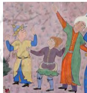
تصویر ۴. پرواز کیکاووس، شاهنامه طهماسبی، مکتب تبریز

در شهر کجاران، مردی به هفتواد مشهور بود، زیرا هفت پسر و یک دختر داشت. یک روز که دخترش مشغول به رشتن نخ بود، کرم روی سیب را برداشته و با یاد خدا در دوک گذاشت