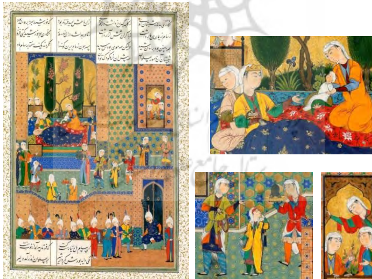
تصویر ۲. تولد زال، شاهنامه طهماسبی، میرمصور، ۹۲۹-۹۴۰، موزه هنرهای معاصر [مأخذ: ۱۳، ۲۴۶]

همسر سام، پهلوان ایران زمین، فرزندی به دنیا آورد که مویی سفید و صورتی چون خورشید داشت. کاهنان او را شوم و نشانه پیامد ناگواری دانستند و سام کودک خود را در کوه البرز جایگاه سیمرغ به دست سرنوشت سپرد... در این نگاره، صحنه تولد زال به نمایش در آمده که هنرمند آن احتمالاً میرمصور بوده است. او صحنه را در کمال زیبایی به چهار قسمت افقی تقسیم کرده. بخش اول از بالا را به کتیبه متن اختصاص داده، در قسمت دوم، همسر سام درحالی که نیمه خوابیده است و روپوش لاجوردی رنگ او را پوشانده، برای گرفتن نوزاد متولدشده دستش را جلو برده و متعجب او را می نگرد و نیم تاجی که بر سر دارد نشان دهنده مقام اوست. در قسمت مرکزی و اندرونی بنا، خدمتکاران در تکاپو و جنب و جوش به تصویر در آمده اند. هریک از آن‌ها ظروف حاوی میوه و گلاب پاش و بخوردان در دست دارند و در میان آن‌ها دخترچه‌ای که انگشت حیرت به لب گرفته نیز به چشم می خورد. هنرمند برای تأکید بیشتر به صحنه، دو زن را پشت به تصویر کشیده که چشم بیننده را به سمت بالا هدایت می کند. قسمت پایین نگاره به خارج بنا تعلق گرفته که مردان صاحب منصب و بزرگان با کلاه‌های قزلباش پشت دیوار در ردیفی منظم ایستاده اند. در این نگاره، همه عناصر به خدمت درآمده اند تا توجه بیننده را به حضور نوزاد با گونه‌های گل انداخته و موهای سفید جلب کنند و به خوبی شرایط زندگی، البسه، و جایگاه زنان و کودکان درباری دوره شاه طهماسب را بازگو می کند (تصویر ۲).