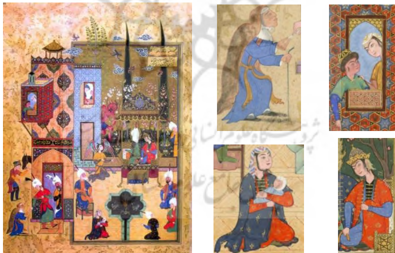
تصویر ۶. مجلس سلیمان و بلقیس، هفت‌اورنگ جامی، مکتب مشهد، ۹۶۳-۹۷۲، گالری فریر، واشنگتن

کز جهان بر من جوانی نگذرد / کاندراو چشمم به حسرت ننگرد در دلم ناید که ای کاش این جوان / بودیم دمساز جان ناتوان (سلامان و ابسال، هفت‌اورنگ جامی) [۳۴].