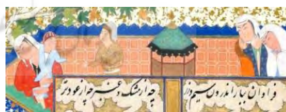
تصویر ۳. انوشیروان هدیه‌های هند را می‌پذیرد، شاهنامه طهماسبی، مکتب تبریز، ۹۲۹-۹۴۰، مجموعه