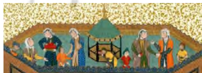
تصویر ۱. نمودن فردوسی هنرش را به سلطان محمود غزنوی، شاهنامه طهماسبی، منسوب به میرمصور، مکتب تبریز، اندازه ۱۷×۴۷/۳، ۹۲۹-۹۴۰، موزه متروپولیتن، نیویورک [مأخذ ۲۳، ص ۲۸]