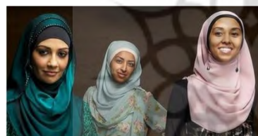
شکل ۱۶. تبلیغات شال و روسری بر مبنای مد عفاف

http://www.smh.com.au/lifestyle/fashion/fabric-interwoven-with-faith-20120427-1xpg8.html