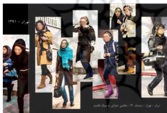
شکل ۶. سوژه‌هایی که متوجه حضور عکاس شده‌اند و به اشکال متفاوت مخالفت خودشان را ابراز کردند.

نمایش زن بر مبنای موازین مذهبی هر گوشه از جهان شکل ویژه‌ای از محدودیت‌ها را به دنبال خواهد داشت. اما این اعتقادات در کنار عادات فرهنگی و عرف جامعه است که شکل تازه‌تری از نحوه پوشش را برای بانوان به ارمغان می‌آورد. مجموعه‌ای تفکیک‌ناپذیر از مذهب، فرهنگ رشدیافته یا نیافته، و تابوهایی که از زمان نامعلومی نشئت می‌گیرند. این مجموعه به هر شکلی که باشد فقط از نظر دیدگاه‌های جنسیتی توجیه‌پذیرند؛ مثلاً، زن در ایران باستان موجود گرانمایه‌ای بود که هرگز موضوعات اروتیک به وی نسبت داده نمی‌شد، چنان‌که حتی در