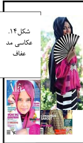
شکل ۱۴. عکاسی مد عفاف

در این وضعیت، ممنوعیت‌ها، و محدودیت‌ها برخی راه سازگاری با تحریم‌های عکاسی مد را به خوبی دریافته‌اند که چنانچه عکس‌های مد در خدمت ترویج پوشش اسلامی مورد قبول مسئولان دولتی باشند، کمی دست عکاس بازتر می‌شود؛ مثلاً اگر به طرح جلد مجلات مختلف در برخی شماره‌ها دقت کنیم (در محدوده عکاسی جلد)، درمی‌یابیم که این عکس‌ها زنان را در حالتی بسیار آزادتر از مجلات مد و پوشاک نمایش می‌دهند (و فقط از نظر لباس بسیار پوشیده هستند و تبلیغ و ترویجی برای این نوع پوشش بین جوانان صورت می‌دهند). یا بسته‌های آموزشی نحوه بستن اسلامی شال و روسری، که در سرتاسر ایران به وفور و از طرف شرکت‌های مختلف عرضه می‌شود، زن‌ها را اندکی به صورت اروتیک و با آرایشی شدید بر چهره نمایش می‌دهند، اما تا مدت زمانی کوتاه یا بلند مخالفتی با تصاویر عکاسی شده روی جلد آن‌ها نمی‌شود، چون به هر حال هدف اصلی‌شان ترویج پوشش اسلامی است (شکل‌های ۹ و ۱۵). حال آنکه در کشورهای دیگر همین نوع تصاویر نیز با رعایت اصول عکاسی مد عفاف تهیه می‌شوند (شکل ۱۶).