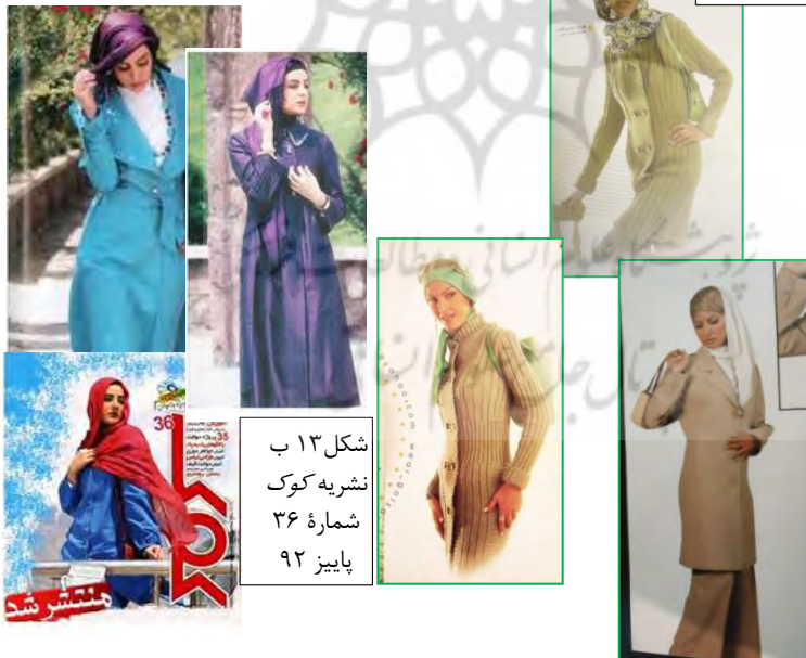
شکل ۱۳ الف. ژست و اشارات، مدل ها در عکاسی مد ایران (منبع: نشریه پوشاک ۸۵ - ۱۳۸۴ (نشریه مسدودشده)