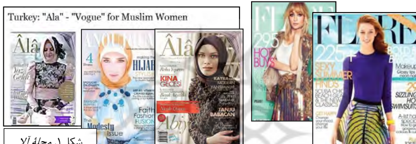
شکل ۱. مجله آلا

منظور از این صراحت، درواقع تمرکز بیشترین توجه به نمایش پوشاک است نه به مدل؛ پس چنان‌که در شکل ۲ مشاهده می‌کنید، فقط لباس این مانکن‌ها با پوشش اسلامی مغایرت دارد و در صورت پوشیده‌شدن، دیگر این تصاویر برای مجلات اسلامی مشکلی نخواهند داشت و حتی در مقایسه با تصاویر مجلات مد ایران از حرکات محدودتر و ساده‌تری استفاده کرده‌اند؛ ۱ به این دلیل که در عکاسی از مد لباس، مدل‌ها فاقد خودنمایی یا حس اروتیک‌اند و حرکت و چرخش آن‌ها فقط برای نمایش بهتر لباس است نه برای نمایش اندامشان؛ پس این تصاویر- در صورت حفظ حجاب- مشکلی ندارند.