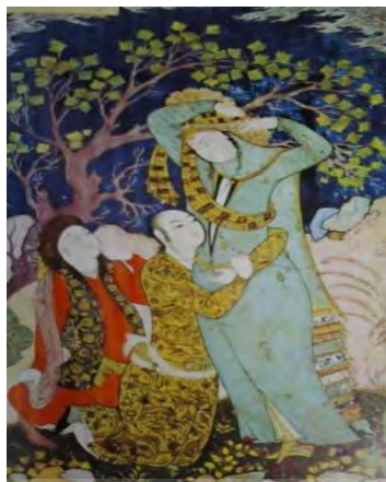
شکل ۸. اروتیک در اندام ملبس

علاوه بر تابوهای مذهبی و تابوهای فرهنگی که گفته شد، نیروی سومی نیز در سرتاسر جهان بر پوشش و نحوه نمایش بانوان حاکم است که همواره از طرف دولت‌ها اعمال می‌شود و برخلاف تابوها، بدون نیاز به شکستن و بر مبنای شرایط کشور می‌تواند تغییر کند. و این است حکایت تکرارپذیر انتشار تصاویر اروتیکی نشریات در قالب حجاب و مسدودشدن انتشارات این تصاویر همچون مجله پوشاک، طاووس، و سایر نشریات بسته‌شده در حوزه پوشاک بانوان ایران. وجه مشترک همه این سه نیرو این است که ظاهراً همه چیز از چشم ذکور رخ می‌دهد؛ چه تابوی مذهبی، چه تابوی فرهنگی، و چه قوانین دولتی همه براساس نگاه مردانه شکل گرفته است. اما صرف‌نظر از همه مباحث فمینیستی- دید پدرسالارانه حاکم بر نحوه نمایش زن و حتی حاکم بر نحوه شکل‌گیری پوشش زنان، از جمله کفش پاشنه‌دار به‌منزله یک فتیش یا بت‌واره ۱ [ص ۲۱، ۷]- می‌توان گفت که مذهب یکسان، لزوماً فهم و برداشت مشابه مذهبی و شکل‌گیری دیدگاه جنسی یکسانی را موجب نمی‌شود. درحقیقت، تابوهای مذهبی تحت‌تأثیر عرف و تابوهای فرهنگی قرار می‌گیرند. همچنان که ایران و سوریه هر دو کشورهای مسلمانی‌اند، اما دیدگاه عمومی درباره نوع پوشش ایشان کاملاً متفاوت است. لباس زنان ایرانی از عصر باستان نیز همواره بر پایه پوششی مضاعف همچون چادر بنا نهاده شده بود (گرچه در برخی اعصار همچون عهد قاجار این پوشش مضاعف‌تر هم شده بود) [ص ۳۳-۵۵].