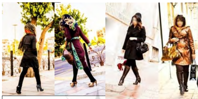
شکل ۵. عکاسی مد در خیابان

تنوع و تحول در شرایط زنان در تاریخ ایران رخ داده است ۱ [۷، ص ۲۹] و همین تزلزل‌ها به نامتعادل بودن در شرایط امروزی نگاه به زن و نمایش بدن وی در چگونگی عکاسی مد مؤثر است که در ادامه بررسی خواهد شد.