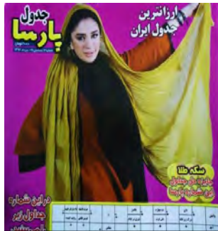
شکل ۱۰. عکاسی مد اروتیکی پوشیده در حجاب