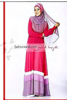
شکل ۴. عکاسی مد عفاف