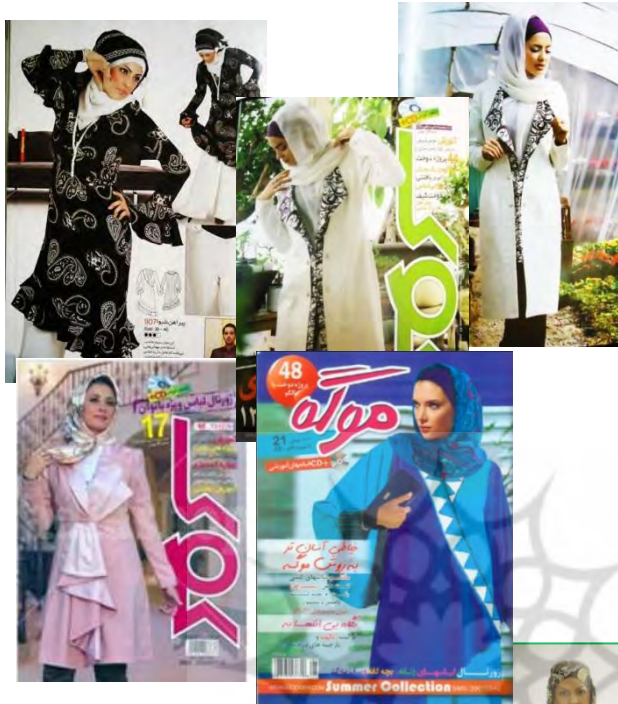
شکل ۱۲. عکاسی مد در ایران اسلامی