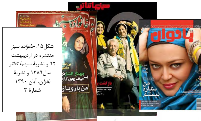
شکل ۱۵. خانواده سبز منتشره در اردیبهشت ۹۲ و نشریه سینما تفاتر سال ۱۳۸۹ و نشریه بانوان، آبان ۱۳۹۰ شماره ۳