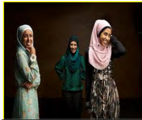
شکل ۱۱. عکاسی مد برای مسلمانان استرالیا (فاقد حس اروتیک)