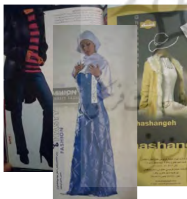
شکل ۳. نشریه پوشاک ایران (مسدودشده)