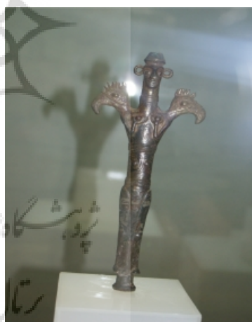
تصویر ۳: تندیس مفرغی الهه مادر، مربوط به ۱۳۰۰-۷۰۰ ق. م. موزه فلک‌الافلاک لرستان.

الهه مادر نه تنها تولد اعضای جدید جامعه را بر عهده داشت، بلکه تولد مجدد مردگان در دنیای دیگر نیز از توانمندی‌های او محسوب می‌شده است. در ناحیه Joches در فرانسه، تصویر یک پیکرک نوسنگی، بر دیواره سردابه‌ای که محل دفن مردگان نیز بوده است، به چشم می‌خورد و چون این تصویر از اتاق دفن مردگان به دست آمده است، می‌توان این گونه استدلال نمود که تفکر رایج در آن زمان بر این دیدگاه استوار بوده است که مردگان نه در خاک، بلکه در رحم مادر جهانی دفن می‌شوند، در آن‌جا دوباره رشد می‌کنند تا مجدداً از طریق رحم همین مادر در دنیای جاودانگی متولد شوند. بر این مینا، اتاق دفن، حکم زهدان مادر و الهه مادر نیز حکم خالق انسان را داشته است (مرکل ۴ ، ۱۹۹۹: ۶۴). همچنین وجود برخی از پیکرک‌ها در داخل ظروف غله، مثلاً در محوطه چاتال هویوک ترکیه، می‌تواند بیانگر این مطلب باشد که الهه مادر قادر است مردمان خود را با دادن غلات و محصولات کشاورزی سیر کند و چون در محوطه چای اونوی ترکیه نیز تصاویر گیاهی همراه با الهه مادر یافت شده، می‌توان این‌گونه برداشت کرد که این الهه دارای تقدس گیاهی و در ارتباط با کشاورزی بوده است (تات ۵ ، ۲۰۰۵: ۹۳). نقش الهه مادر به وفور بر روی آثار مفرغی لرستان نیز به تصویر درآمده است (تصویر شماره ۳).