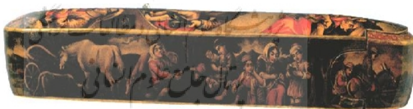
تصویر ۵: مشارکت زنان در اقتصاد جامعه خود، نمای جانبی، متعلق به ابتدای سده بیستم/چهاردهم، اصفهان یا تهران