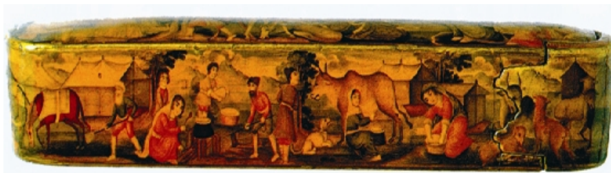
تصویر ۱: مشارکت زنان در اقتصاد خانواده، نمای جانبی قلمدان متعلق به نیمه اول سده نوزدهم/سیزدهم