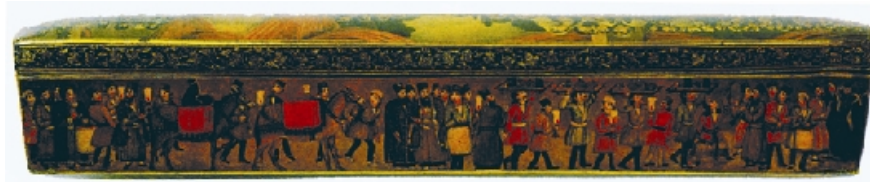
تصویر ۱۲: مراسم ازدواج، همراهی عروس به منزل و طبق کشی هدایا، نمای جانبی متعلق به ۱۳۲۲/۱۹۰۴، تهران