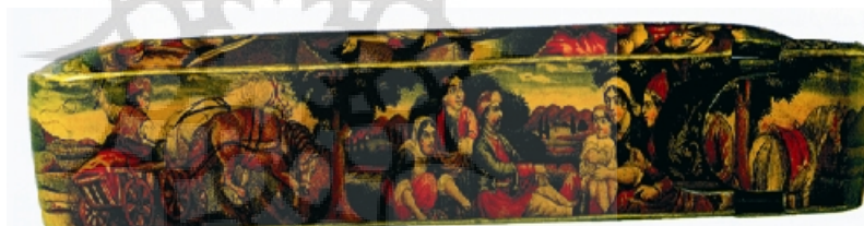
تصویر ۳: مشارکت زنان در فعالیت و زندگی خانوادگی، نمای جانبی قلمدانی متعلق به ۱۲۸۷/۱۸۷۰، شیراز