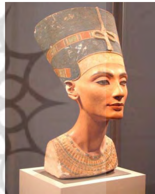
* موزه بریتیش لندن

یکی دیگر از این ملکه‌های قدرتمند، آنخسا (به معنای: دختری که برای آتون زندگی می‌کند) است: دختر سوم آخناتون و نفرتی‌تی، همسر توتانخامون معروف که آرامگاهش کاملاً دست نخورده در نهم نوامبر ۱۹۲۲ به دست هاوارد کارتر، مصرشناس انگلیسی، کشف و باز شد. «اسباب و اثاثیه، پاپيروس‌ها و سنگ‌نوشته‌هایی که در این آرامگاه پیدا شدند، همگی حکایت از عشق بی حد توتانخامون به همسرش دارند و نقش کلیدی این ملکهٔ مصمم و با اراده را در ادارهٔ سرزمین به تصویر کشیده‌اند.» (گرونی، ۱۹۹۷: ۱۰۷). روی صفحه‌ای از جنس عاج او را می‌بینیم که پیراهنی بلند و پلیسه به تن دارد و دو مار کبرای روی تاجش، که مقابل پیشانی‌اش قرار دارند، سمبل سلطۀ او بر سراسر سرزمین مصر هستند. روی پشتی اریکهٔ سلطنت، او را با چهره‌ای جافتاده‌تر می‌بینیم که تاجی شامل دو شاخ گاو ماده با خورشیدی در وسط و دو پر بلند در دو طرف به سر دارد: پرها نشانهٔ نفس ملکوتی و دو شاخ گاو ماده