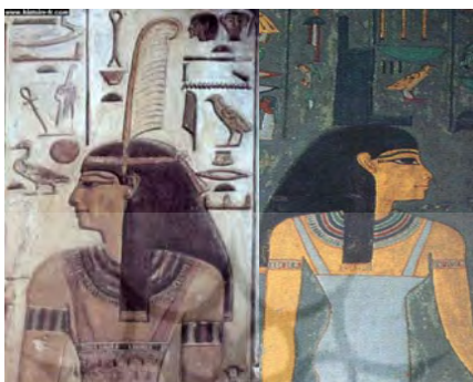
«پرعدالت» بر سرش. آرامگاه ستی اول. آفریننده جهان