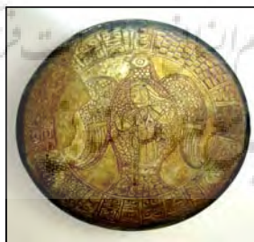
تصویر شماره ۲/ الف