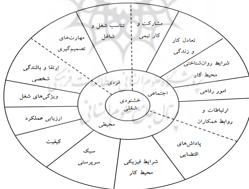
شکل ۳. الگوی نهایی پژوهش