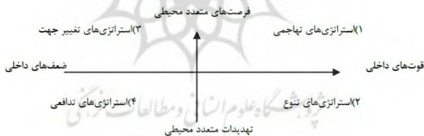
شکل ۳: نمودار تجزیه و تحلیل SWOT در اکوتوریسم روستایی

منابع: (a): (جهانپان و زندی، ۱۳۸۹)، (c): (صادقی و دیگران، ۱۳۹۱)، (d): (برزگر، ۱۳۹۱)، (e): (ابراهیم‌زاده و یاری، ۱۳۹۰)، (f): (رکن‌الدین افتخاری و مهدوی، ۱۳۸۵)، (g): (بدری و دیگران، ۱۳۹۰)، (h): (Dehghan and at el, 2010)، (i): (هاشمی، ۱۳۸۹)، (j): (رکن‌الدین افتخاری و دیگران، ۱۳۸۹)، (l): (Thomas and at el, 2011)، (o): (Stefăniacă, 2010).