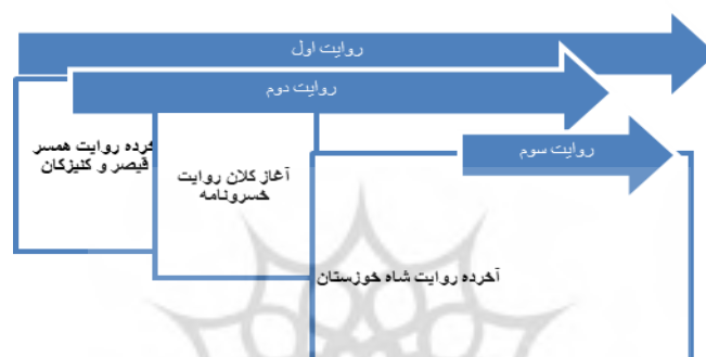
شکل ۲) کلان روایت خسرونامه و خرده روایت‌های نهفته در آن

در داستان «خسرونامه» یک پیرنگ اصلی با پنج موقعیت روایی به چشم می‌خورد. اما علاوه بر این ساختار، ساختار پیرنگ دیگری نیز در وضعیت ابتدایی پیرنگ خرده روایت اول دیده می‌شود. در این داستان، ماجرای همسر قیصر و کنیزکان خرده روایتی در دل کلان روایت اصلی است که باعث ایجاد پیرنگ دیگری در وضعیت ابتدایی داستان شده است.