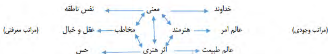
آفرینش هنری از دیدگاه مولانا (جلیلیان، ۱۳۹۴: ۱۳)

اگر انسان خلیفه خداست آفرینش‌های هنری او نیز باید تقلید و بازتاب آفرینش خداوند باشد و با همان هدف و مقصود صورت گیرد. ارتباط هنرمند از نظر مولانا به شکل نمودار زیر می‌باشد (جلیلیان، ۱۳۹۴: ۱۳).