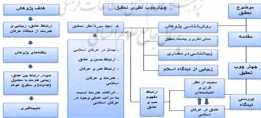
شکل ۱. چهارچوب نظری تحقیق

نمودار ۱ چهارچوب نظری ارتباط وجوه گوناگون عشق و زیبایی را نمایش می‌دهد که نشان‌دهنده رابطه هم‌زمان عشق هنرمند با زیبایی است. هنرمند در عرفان اسلامی به واسطه عشق به زیبایی سر و کار دارد. در این دیالوگ عناصر جانبی و اتصال دهنده زیبایی، عشق است که هنرمند در درجه اول با قوای شهودی باطنی کسب می‌نماید و در ادامه به قوای خیال، به آفرینش زیبایی و آثار هنری دست می‌یابد.