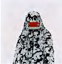
تصویر ۱: پروژه مثل هر روز، (URL3)

در تصویر ۱، یک زن با چادر طرح‌دار پوشانده شده است. از سر تا نیم‌تنه‌اش در مرکز کادر قرار دارد و یک فنجان قرمز با نعلبکی مقابل صورتش است. فارغ از اینکه آن زن در کجای دنیا زندگی می‌کند و چه فعالیت‌هایی دارد، آنچه در این اثر حائز اهمیت است، همه فهم بودن آن است. برای مثال، فرقی نمی‌کند این زن ایرانی باشد یا امریکایی و فرانسوی، هر زنی در هر جای دنیا، دغدغه‌های مربوط به خانه‌داری و نگرانی فرزندان را دارد.