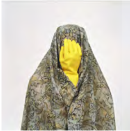
تصویر ۲: پروژه مثل هر روز، (URL3)

در تصویر ۱، یک زن با چادر طرح‌دار پوشانده شده است. از سر تا نیم‌تنه‌اش در مرکز کادر قرار دارد و یک فنجان قرمز با نعلبکی مقابل صورتش است. فارغ از اینکه آن زن در کجای دنیا زندگی می‌کند و چه فعالیت‌هایی دارد، آنچه در این اثر حائز اهمیت است، همه فهم بودن آن است. برای مثال، فرقی نمی‌کند این زن ایرانی باشد یا امریکایی و فرانسوی، هر زنی در هر جای دنیا، دغدغه‌های مربوط به خانه‌داری و نگرانی فرزندان را دارد.