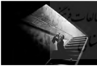
تصویر ۵: پروژه شاپرک خانوم، (URL3)

در تصویر ۴، زنان همگی در سایه و تاریکی، در مقابل روزنه‌های نور، تار می‌تندند. آن‌ها در حکم شاپرک‌هایی هستند که تور عنکبوت اسیر و گرفتار شده‌اند و راهی برای رهایی باید پیدا کنند. سیاه و سفید بودن عکس دلالت بر ناامیدی سوژه دارد.