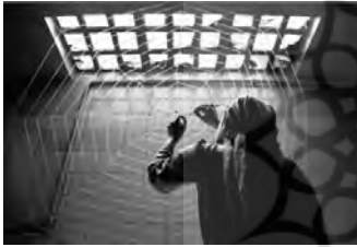
تصویر ۴: پروژه شاپرک خانوم، (URL3)

در پی وعده‌ای که با آفتاب دارد، در جست‌وجوی راه خروج و رسیدن به نور در تار عنکبوت گرفتار می‌شود و عنکبوت که با دیدن زیبایی و ظرافت شاپرک خانوم، دلش به رحم آمده و با شاپرک خانوم قرار می‌گذارد که یکی از حشرات داخل انباری تاریک را برایش بیاورد و در تارهای تنیده‌اش گرفتار کند تا راه خروج و رسیدن به نور را نشان دهد، اما شاپرک خانوم هر بار بعد از شنیدن درد دل حشرات دلش می‌سوزد و در نهایت، دست خالی با بال‌های خراشیده نزد عنکبوت بازمی‌گردد و خود را در تار می‌اندازد تا غذای او شود. عنکبوت که از ماجرا خبر دارد دست‌های شاپرک خانوم را از تارها، رها می‌کند و راه خروج را به او نشان می‌دهد تا به وعده دیدارش با آفتاب برسد. شاپرک خانوم حشرات را فرامی‌خواند تا آن‌ها نیز در این آزادی سهمی داشته باشند، اما هیچ پاسخی نمی‌شنود. شاپرک خانوم، مأیوس از رفتار حشرات دیگر، بال‌های خسته‌اش را باز می‌کند و به سمت نور می‌رود (خاوری، ۱۳۸۹: ۱۸).