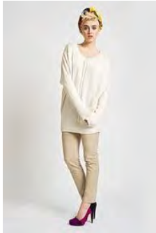
تصویر ۹: نمونه عکاسی مد در سبک کاتالوگ

کاتالوگ: عکس‌های مد و فشن که برای کاتالوگ‌های تبلیغاتی استفاده می‌شوند، نوع معمولی‌تر و کم‌اهمیت‌تری از عکاسی مد و فشن را به خود اختصاص می‌دهند. هدف از تهیه کاتالوگ‌های تبلیغاتی ارایه یک نمایش عادی از نوع پوشاک قابل استفاده در زندگی روزمره است. بنابراین عکس‌های کاتالوگ را با مدل‌های کمتر حرفه‌ای و در محیط‌های آتلیه‌ای ساده می‌توان به دست آورد.