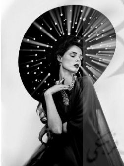
تصویر ۷: نمونه عکاسی مد در سبک ادیتوریال

ادیتوریال (editorial): اگر هدف از عکاسی مد و فشن تهیه تصاویر برای استفاده از مجلات مخصوص مد باشد، این سبک عکاسی ادیتوریال نامیده می‌شود. در این سبک از عکاسی، از یک بیان داستان‌گونه برای روایت حالت‌های زندگی مدل‌ها در درون قاب تصویر استفاده می‌شود. از سوی دیگر، طراحان لباس و مد نیز بر اساس داستان‌های تعریف شده به نمایش محصولات خود با استفاده از این مدل‌ها می‌پردازند.