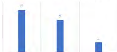
نمودار ۷: پاسخ سوال ۷، (نگارنده)