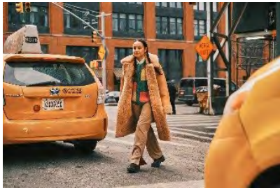
تصویر ۱۰: نمونه عکاسی مد در سبک خیابانی

عکاسی مد و فشن خیابانی: عکاسی مد و فشن در خیابان یکی از انواع نسبتاً جدید عکاسی به شمار می‌آید و در آن لوکیشن عکاسی، سطح خیابان‌های شهر می‌باشد. البته با توجه به مهارت عکاس و نوع برند، عکس‌های مد و فشن خیابانی در هر دو گروه ادیتوریال و یا کاتالوگ نیز قابل استفاده خواهند بود. در عکاسی خیابانی، مدل در زندگی روزمره و با حالت‌هایی عادی نمایش داده می‌شود و از ژست‌ها و نورپردازی‌های آنچنانی، اثری دیده نمی‌شود.