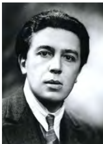
تصویر ۶: آندره برتوتون

جنگ جهانی دوم و دهه ۱۹۵۰ میلادی: وقوع جنگ باعث شد تا بسیاری از نقاشان، مجسمه‌سازان و عکاسان اروپایی به مکانی امن مثل ایالات متحده کوچ کنند. این روند در سال‌های دهه ۱۹۳۰ میلادی آغاز شد و از زمان قدرت پیدا کردن هیتلر در آلمان در سال ۱۹۳۳ شتاب گرفت. بنابراین طراح و عکاسی مثل آلکسی برودویچ در سال ۱۹۳۰ از پاریس به سمت نیویورک مهاجرت کرد.