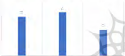
نمودار ۴: پاسخ سوال ۴، (نگارنده)