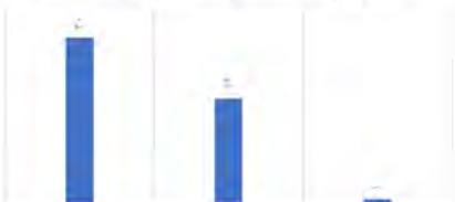
نمودار ۸: پاسخ سوال ۸، (نگارنده)