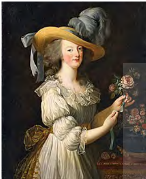
تصویر ۱: ماری آنتوانت واپسین ملکه همسر فرانسه پیش از انقلاب فرانسه نماد خوش‌پوشی و مد در دوره خود بود

طراحی پوشاک و زیورآلات کار می‌کنند؛ بعضی به تنهایی و بعضی به عنوان بخشی از یک گروه به این حرفه مشغول هستند. آن‌ها با تلاش برای طراحی لباس‌های زیبا و باب طبع جامعه سعی در بیشتر کردن تمایل مصرف‌کنندگان دارند. به دلیل اینکه طراحی و ارائه لباس‌های جدیدی که مورد پسند عموم قرار بگیرند فرایندی زمان‌بر است، متخصصان این حرفه در عین حال باید بتوانند به‌طور دقیق، زمان تغییر سلیقه مصرف‌کننده را پیش‌بینی کنند. مد و رسانه آن که پوشاک است نمادی از وضعیت اجتماعی و اقتصادی جوامع هستند.