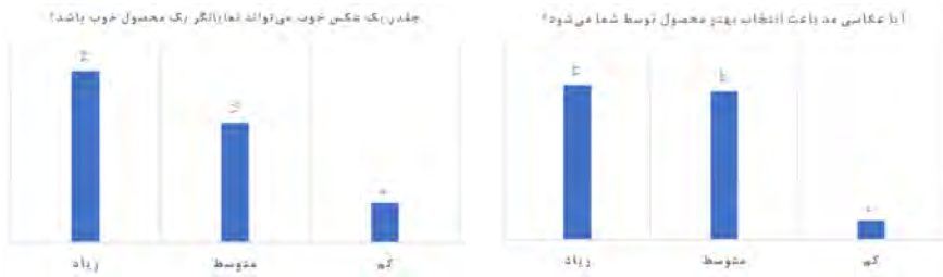
نمودار ۹: پاسخ سوال ۹، (نگارنده)