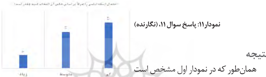
نمودار ۱۱: پاسخ سوال ۱۱، (نگارنده)