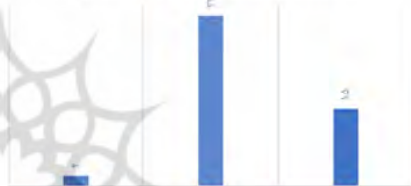
نمودار ۳: پاسخ سوال ۳، (نگارنده)