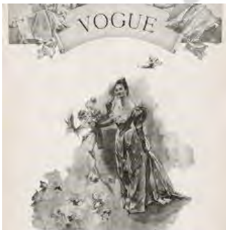
تصویر ۵: جلد اولین شماره مجله وگ

نخستین عکس‌های مد در سال ۱۸۶۰ میلادی تولید شدند تا خلاقیت و پیشرو بودن خانه‌های مد پارسی را به اثبات برسانند. تصور می‌شد که ایده به کار بردن مدل‌های حرفه‌ای یک حرکت متناقض است. بنابراین عکاسان مد به شخصیت‌های مشهور اجتماعی از جمله گرتورود وندربیلت ویتنی (Gertrude Vanderbilt Whitney) یا سارا برنارد (Sarah Bernhardt) به عنوان مدل تکیه می‌کردند. حتی وقتی در ادامه مدل‌های تمام وقت مورد استفاده قرار گرفتند، چهره آن‌ها به جای عکس گرفتن توسط نقاشان ترسیم می‌شد، زیرا طراحان و خیاطان زن تصور می‌کردند که رازهای آن‌ها توسط عکس‌ها فاش خواهد شد. به دنبال اختراع فرآیند چاپ هاف تن توسط فردریک آیوز (Frederic Eugene Ives)، عکس‌های مد در اواخر دهه ۱۸۸۰ میلادی مورد استفاده قرار گرفتند و در مجلات مد چاپ شدند.