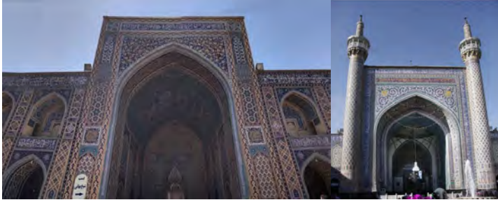
تصاویر ۴ و ۵: ایوان مقصوره و نمای ایوان شرقی و غربی مسجد گوهرشاد. (URL4)

بنا شده است. همچنین در وسط پایه‌های ایوان سوره‌هایی از قرآن کریم به خط بنایی نوشته شده است (مردانی و لندانی، ۱۳۹۴).