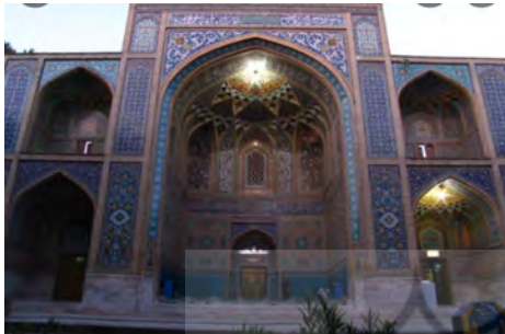
تصویر ۳: ایوان بقعه امامزاده محروق، (URL3)

طرف شامل یک حجره دو طبقه است و در جلوی آن ایوانکی قرار دارد. ازاره ایوان حاشیه‌ای از کاشی معرق در زمینه لاجوردی و گل و برگ زرد و آبی دارد که در بالای ازاره مذکور نقش گره با کاشی معرق در زمینه سفید و لاجوردی و بسیار پر جلوه است. گره این قسمت از نوع چهار شمسه سرمه‌دان است (سر گلزائی و طاهری، ۱۳۹۷).