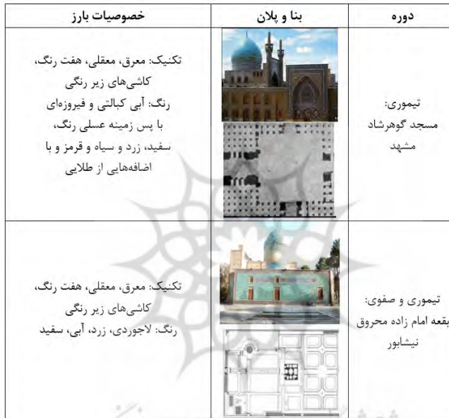
جدول ۱: مقایسه تطبیقی معماری مسجد گوهرشاد و بقعه امام زاده محروق، (نگارنده)

نام دارد که بزرگترین ایوان است. ایوان شمالی، معروف به ایوان دارالسیاده است. ایوان شرقی، ایوان اعتکاف و ایوان غربی، ایوان شیخ بهاء الدین نامگذاری شده‌اند. چهار ایوان این مسجد در صحن مربعی شکل قرار گرفته‌اند و در فواصل میانی ایوان‌ها نیز شبستانی‌های وسیعی به چشم می‌خورند (مردانی و لندانی، ۱۳۹۴).