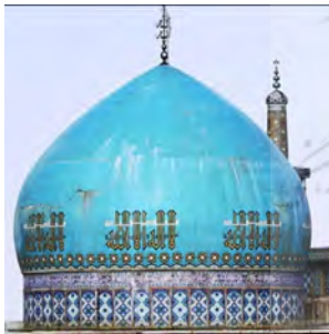
تصویر ۲: گنبد مسجد گوهرشاد، (URL2)

با توجه به اینکه مجموعه آرامگاه امامزاده محروق نیشابور مدفن دو شخص متوفی است، آرامگاه امامزاده محروق دو گنبد دارد که گنبد امامزاده محروق نیشابور دارای ساقه‌ای بلندتر از گنبد امامزاده ابراهیم است و با تزئینات زیبای کاشی کاری آراسته شده است؛ به گونه‌ای که بازدیدکنندگان فیروزه‌های در میان باغی سرسبز چشمان شما مسحور بازی رنگ و لعاب کاشی‌ها و هنر دست هنرمندان معمار ایرانی می‌شود. بقعه امامزاده محروق و ابراهیم شامل یک گنبد نار بزرگ با ارتفاع ساقه پنج متر (متعلق به امامزاده محروق)، یک گنبد نار کوچک با ساقه کوتاه (متعلق به امامزاده ابراهیم) و یک ایوان بزرگ و رفیع رو به شمال به عرض داخلی ۸/۷۰ متر و ارتفاع حدودی ۱۲ متر با قدر نمای بیرون بقعه، دو گنبد دیده می‌شود که قسمت ساقه گنبد بزرگ‌تر، شامل تزئینات کاشی با طرح گره صابونی چهار و هشت و لوزی است و در روی پوسته آن، کاشی الوان با نقوش شمسه، لوزی است که درون آن با حروف معقلی مزین به نام‌های علی و ربی می‌باشد که بر روی ته رنگ فیروزه‌ای قرار دارد و تیزه دار و کتیبه است (جعفری فرد، مرشدی و میرسجادی، ۱۳۹۲)