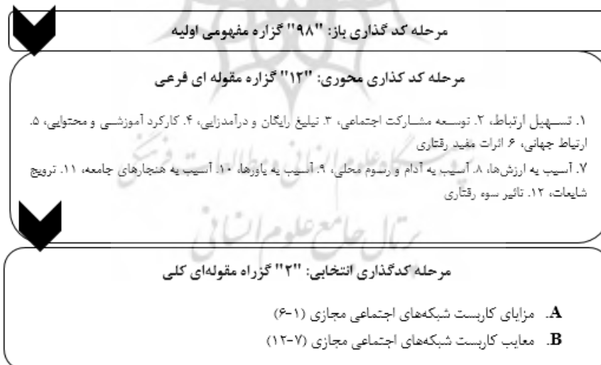
شکل ۲: فرایند مدیریت داده‌ها و تکامل مدل در سه مرحله کدگذاری باز و محوری و انتخابی

پس از انجام مصاحبه تا مرحله اشباع و استخراج مقولات، در نهایت ۹۸ مقوله مفهومی اولیه، ۱۲ مقوله فرعی و ۲ مقوله اصلی به دست آمد. جزئیات مقولات به دست آمده در اشکال شماره ۲ یعنی کدگذاری داده‌ها و شماره ۳ یعنی الگوی فایده‌مندی کاربست شبکه‌های اجتماعی مجازی و مقوله‌بندی‌ها در قالب جدول ۲، نشان داده شده است.