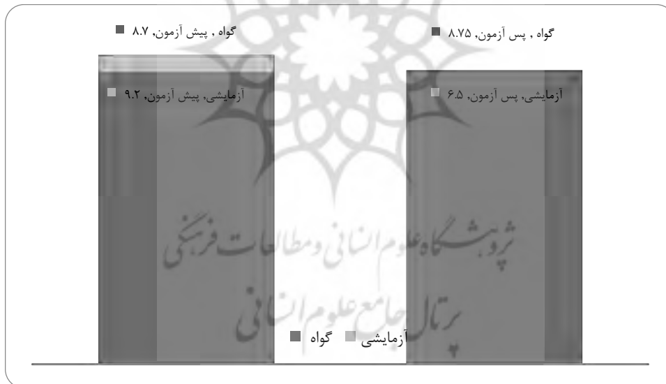
نمودار ۳: نمودار میانگین در آزمون پرخاشگری TA

میانگین پس‌آزمون نسبت به پیش‌آزمون در گروه آزمایشی کاهش یافته است که شاید بتوان آن را ناشی از تأثیر قصه درمانی به روش TA دانست. میانگین نمره آزمودنی‌ها در گروه‌های پژوهشی (آزمایشی و گواه) در دو نوبت اجرا (پیش‌آزمون و پس‌آزمون) در مقایسه با یکدیگر در نمودار ۳-۱ نشان داده شده است.