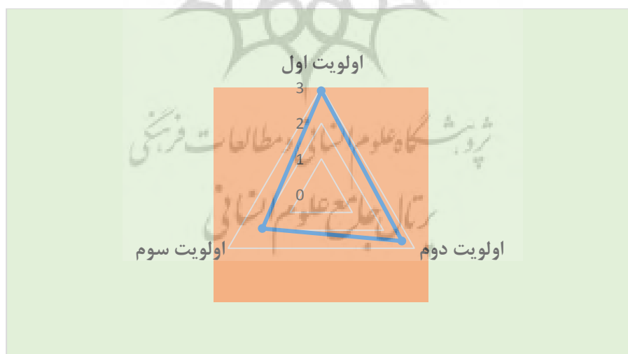
نمودار ۲: اولویت‌بندی برنامه‌های اقدامی توانمندسازی محلات