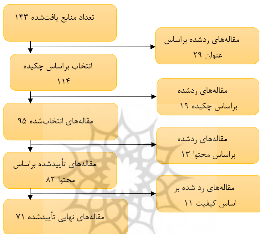
شکل ۱. شیوه انتخاب مقاله‌ها

مقاله انتخاب شد. جهت ارزیابی کیفیت این پژوهش‌ها از روش ارزیابی حیاتی کسپ (CASP) استفاده شد. در شکل ۱ شیوه انتخاب مقاله‌ها در این مرحله ارائه شده است.