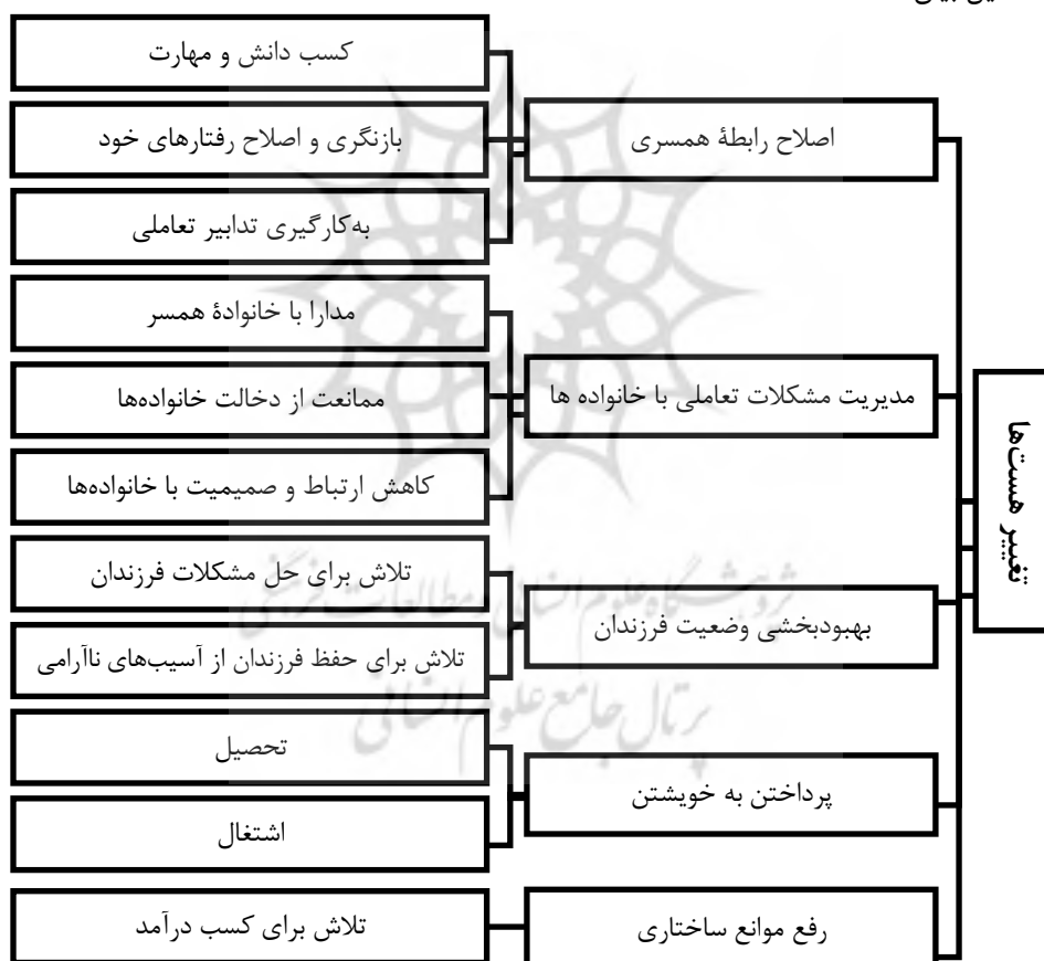
شکل ۳. نمودار مفهومی مقوله «تغییر هست‌ها»

مقوله «تغییر هست‌ها» بیان‌گر راهبردهای زنان با رویکرد تغییر وضعیت موجود برای احساس آرامش در زندگی زناشویی است که ابعاد مفهومی آن در شکل ۳ نشان داده شده و در ادامه به تفصیل بیان شده است.