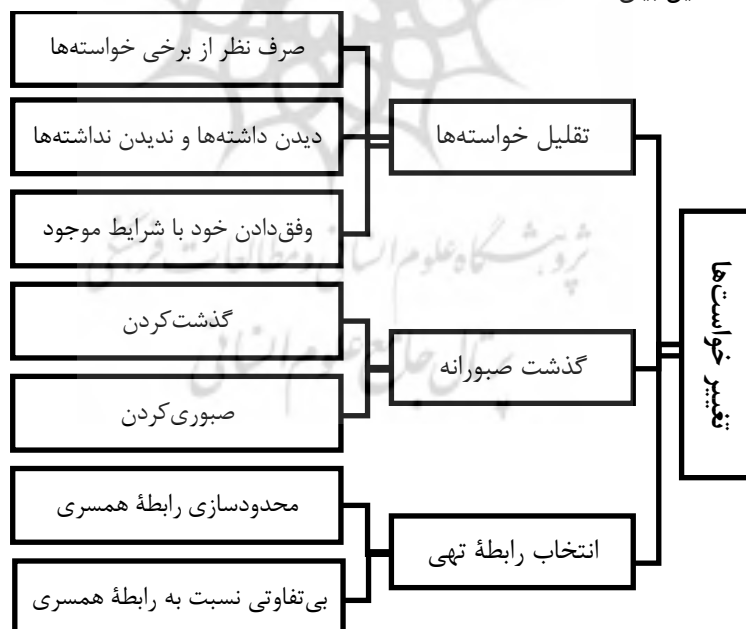
شکل ۴. نمودار مفهومی مقوله محوری «تغییر خواست‌ها»

مقوله «تغییر خواست‌ها» بیان‌گر راهبردهای زنان با رویکرد تغییر خواسته‌های خود برای احساس آرامش در زندگی زناشویی است که ابعاد مفهومی آن در شکل ۴ نشان داده شده و در ادامه به تفصیل بیان شده است.