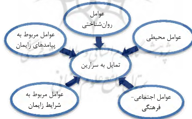
شکل ۱. مدل مفهومی عوامل تأثیرگذار در تمایل به سزارین در زنان باردار

براساس مطالعات یادشده و نظریه‌ها و تئوری‌های تحقیق، شکل ۱ مدل مفهومی عوامل تأثیرگذار در تمایل به سزارین را در زنان باردار نشان می‌دهد.