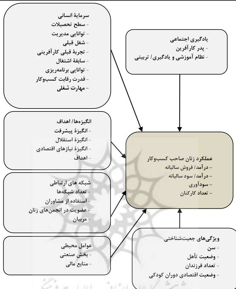
شکل ۱. مدل عملکرد زنان صاحب کسب و کار [۳۰]