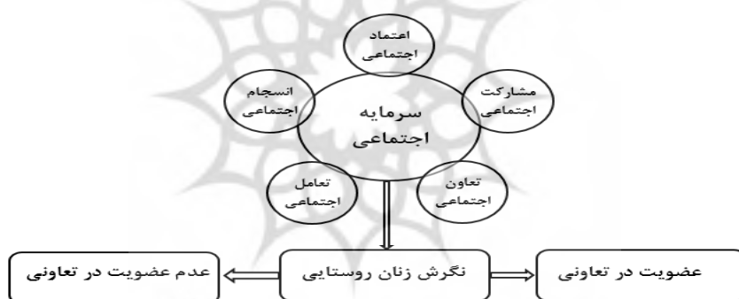
شکل ۱. چارچوب مفهومی پژوهش (تنظیم: پژوهشگران)

مرور ادبیات پژوهش نشان می‌دهد که تاکنون تعاریف و شاخص‌های مختلفی برای اندازه‌گیری سرمایه اجتماعی معرفی شده‌اند، اما مهم‌ترین تعریفی که تاکنون از سرمایه اجتماعی بیان شده است و پایه و اساس اکثر مطالعات انجام گرفته است تعریف پاتنام از سرمایه اجتماعی است. در این پژوهش، همان‌طور که چارچوب مفهومی نشان می‌دهد، مطابق با جمع‌بندی تعریف پاتنام و دیگر تعاریف، سرمایه اجتماعی در مجموع به وسیله پنج مؤلفه اعتماد اجتماعی، مشارکت اجتماعی، تعامل اجتماعی، انسجام اجتماعی و تعاون اجتماعی مشخص شده است.