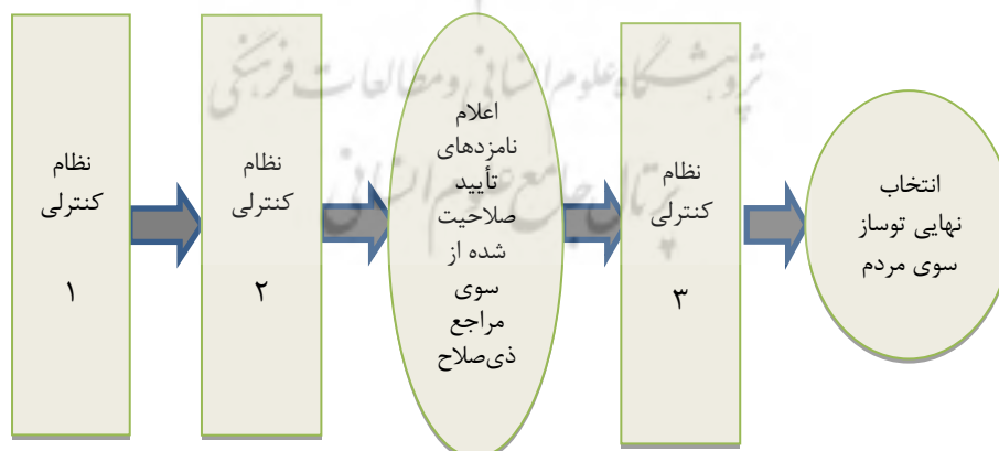
شکل ۲. معیارهای تأثیرگذار در نظام‌های کنترلی سه‌گانه

با توجه به توضیحاتی که درباره عوامل سه‌گانه گفته شده داده شد، مدل پیشنهادی نگارنده برای فهم بهتر سازوکار یا فرایند انتخاب زنان در نظام‌های سیاسی نظیر جمهوری اسلامی ایران بدین شرح است. بدیهی است این مدل مختص به زنان نبوده و بنا به اقتضای موضوع می‌تواند علاوه بر زنان مشارکت مردم را به طور کلی و سایر اقشار جامعه را به شکل خاص در معرض بررسی قرار دهد: