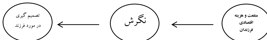
شکل (۱) مدل اقتصادی لیبشتاین

طبق نظر لیبشتاین، منافع و هزینه‌های فرزندان بر فرآیند تصمیم‌گیری عقلایی زوجین در مورد داشتن بچه، تأثیر می‌گذارد. وی سه نوع منفعت و دو نوع هزینه را در مورد فرزندان مطرح می‌کند. به طور کلی فرزندان در سه زمینه می‌توانند منشأ سود و منفعت برای والدین خود باشند. کالا بودن فرزندان به عنوان یک منبع لذت برای والدین، نیروی کار قلمداد شدن و تامین و نگهداری والدین در سنین کهولت یا وضعیت‌های دیگر مثل بیماری یا از کارافتادگی. هزینه‌های فرزندان نیز به دو دسته مستقیم و غیرمستقیم تقسیم می‌شود. هزینه‌هایی چون تعلیم و تربیت و آموزش، نگهداری و مراقبت‌های مختلف از فرزندان تا زمانی که به مرحله منفعت اقتصادی برسند، هزینه‌های مستقیم می‌باشند و هزینه‌های غیرمستقیم نیز در واقع مربوط به فرصت‌هایی است که مادران به خاطر نگهداری از فرزند خویش از دست می‌دهند. لیبشتاین نتیجه می‌گیرد که اگر منافع اقتصادی حاصل از وجود فرزند بیشتر از هزینه‌های دوگانه آن باشد، خانواده انگیزه پیدا می‌کند که فرزند بیشتری داشته باشد. او بر این باور است که در یک جامعه رفتارهای باروری ناشی از یک رفتار اقتصادی عقلایی است (حسینی، ۱۳۸۱: ۵۰-۵۱).