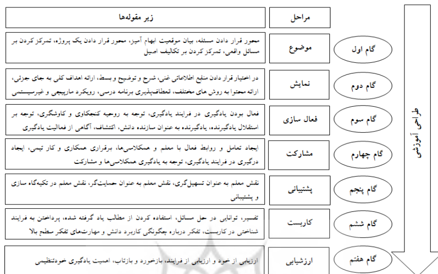
Shape 2. Operational model framework of the educational model based on constructivism