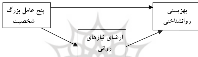
مدل ۱. مدل فرضی پژوهشگر در مورد روابط ساختاری میان متغیرها

مانت ۱ (۱۹۹۳) و انگلدو، مارکلند و شپرد ۲ (۲۰۰۴) بین پنج عامل بزرگ شخصیت و میزان ارضای نیازهای روانی رابطه وجود دارد. علاوه بر این بر اساس تحقیقات چینگ چو ۳ (۲۰۰۶)، جنگینز ۴ (۲۰۰۵)، بین میزان ارضای نیازهای روانی با بهزیستی رابطه وجود دارد. همان طور که ملاحظه شد هیچکدام از تحقیق‌ها ارتباط بین پنج عامل شخصیت و بهزیستی روانی با در نظر گرفتن متغیرهای واسطه‌ای «نیازهای روانی» را مورد بررسی قرار نداده‌اند. با توجه به پیشینه نظری و تجربی مطرح شده این مطالعه در پی آن است که مدلی برای ارتباط بین پنج عامل بزرگ شخصیت، ارضای نیازهای روانی با بهزیستی روان‌شناختی ارائه دهد.