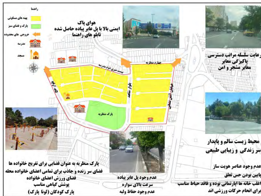
شکل ۳: تحلیل یکپارچه محله منظره شامل مسائل، نیازها و ظرفیت‌های محله مقصودیه از منظر حقوق شهروندی