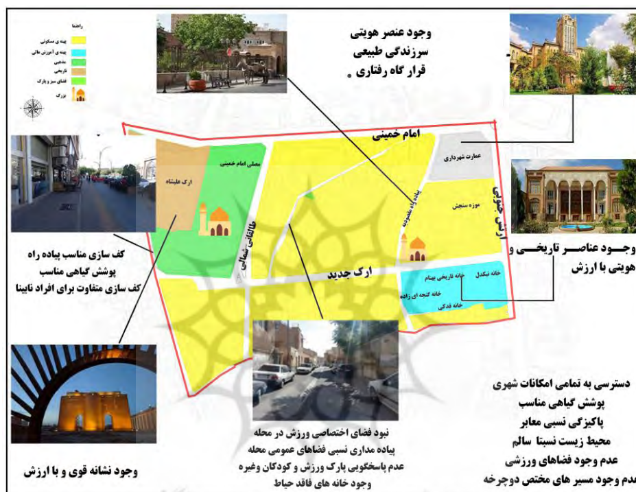
شکل ۲: تحلیل یکپارچه محله مقصودیه شامل مسائل، نیازها و ظرفیت‌های محله مقصودیه از منظر حقوق شهروندی

۱/۶۴۳/۹۶۰ نفر رسیده است که بر این اساس، پنجمین شهر پرجمعیت ایران به شمار می‌رود. محدوده مورد مطالعه، شامل دو محله مقصودیه و منظریه است. مقصودیه یکی از محله‌های مرکزی، شاخص و معتبر منطقه ۸ شهرداری تبریز و در مجاورت کاخ شهرداری تبریز واقع شده است. مرکز محله بر اثر مسیرگشایی و ساختمان‌سازی از بین نرفته و از معدود مراکز محله‌های باقی‌مانده در شهر تبریز است. این محله در گذشته، یکی