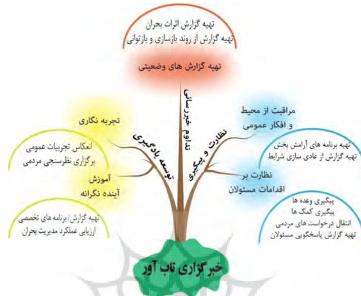
شکل ۲: الگوی خبرگزاری تاب‌آور در برابر بحران‌های طبیعی (پس از وقوع)

در مجموع، پس از مشورت با متخصصان موضوع، ترکیب یافته‌های بخش اول تحقیق شامل مرور سیستماتیک منابع و بخش دوم شامل مصاحبه‌های تخصصی، بازبینی موارد دارای هم‌پوشانی و خارج از اهداف تحقیق و همچنین، جرح و تعدیل‌ها و دسته‌بندی مجدد، ابعاد، مؤلفه‌ها و شاخص‌های تجمیعی تاب‌آوری خبرگزاری‌های ایران در برابر بحران-های طبیعی (در مرحله پس از بحران)، به ترتیب شامل ۳، ۵ و ۱۲ عنوان، تدوین گردیدند. جدول شماره ۶، ابعاد، مؤلفه‌ها و شاخص‌های تجمیعی تاب‌آوری خبرگزاری‌های ایران در برابر بحران‌های طبیعی (در مرحله پس از بحران) و شکل شماره ۲، الگوی خبرگزاری تاب‌آور در برابر بحران‌های طبیعی (در مرحله پس از بحران) را ارائه می‌دهد.