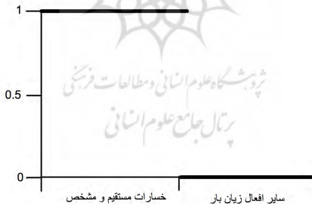
تصویر ۲. طرح شماتیک درجه‌بندی ارزش‌ها در منطق دووجهی

در حقیقت، در منطق فازی، درست بودن یک گزاره، به صورت درجه‌بندی تعریف می‌شود و درست و نادرست بودن آن محدود به صفر (به معنای نادرست) و یک (به معنای درست) نیست. بلکه، درستی یا نادرستی گزینه‌ها در یک محدوده‌ای از ارزش‌های دنباله‌دار بین صفر (کاملاً غلط) تا یک (کاملاً درست) تعریف می‌شوند (Delmas-Marty, 2000: 773). این تحلیل در طرح‌های شماتیک زیر مشخص‌تر می‌شود.