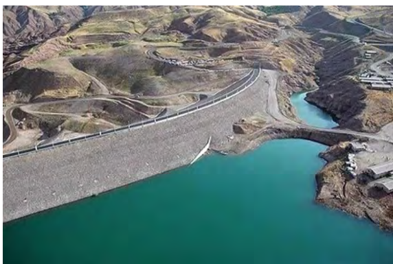
شکل ۳. نمایی از دریاچه و سد طالقان (شهرداری طالقان، ۱۴۰۰)