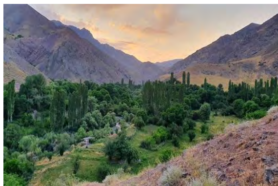
شکل ۲. تصویری از قله شاه البرز (شهرداری طالقان، ۱۴۰۰)