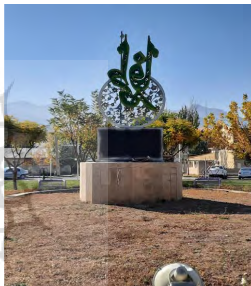
شکل ۴. تصویری از میلان میدان امام خمینی طالقان (شهرداری طالقان، ۱۴۰۰)