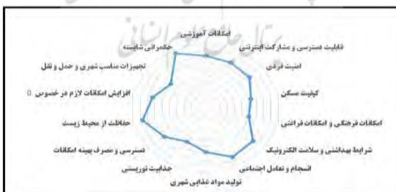
شکل ۴. اولویت هر یک از خدمات شهری هوشمند در دبی، منبع: یافته‌های تحقیق، ۱۴۰۱

اجتماعی با مقدار وزن ۰/۴۲۲، شرایط بهداشتی و سلامت الکترونیک با مقدار وزن ۰/۴۱۱، امکانات آموزشی با مقدار وزن ۰/۴۰۰، قابلیت دسترسی و مشارکت اینترنتی با مقدار وزن