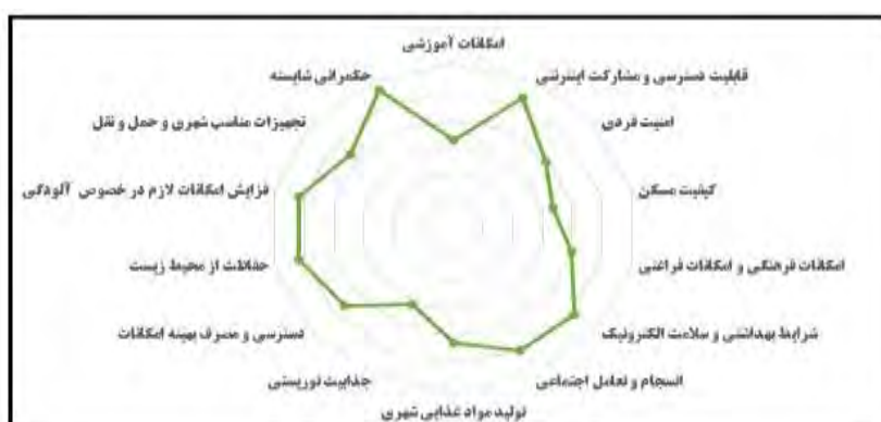
شکل ۳. اولویت هر یک از خدمات شهری هوشمند در کیش، منبع: یافته‌های تحقیق، ۱۴۰۱