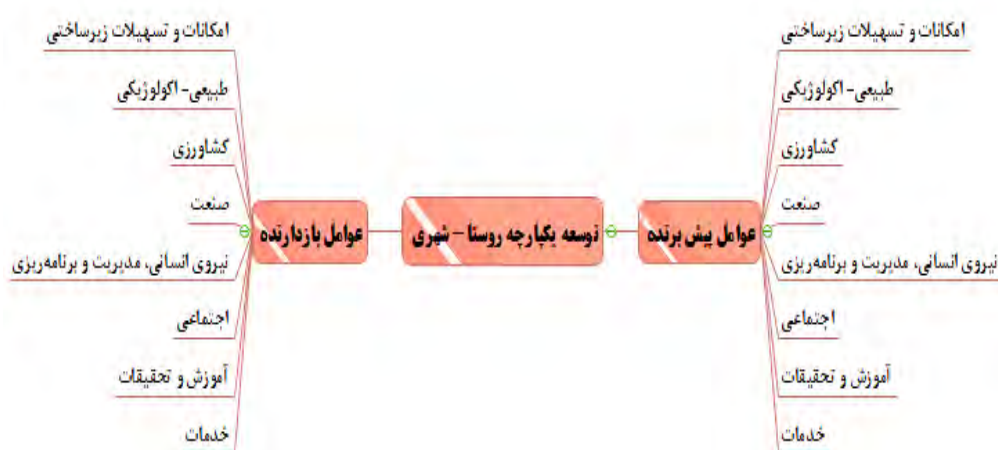
شکل ۱. مدل مفهومی پژوهش