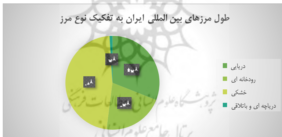
شکل ۲. طول مرزهای جغرافیایی ایران به تفکیک نوع مرز

آسیب‌پذیری جغرافیایی کشور و برنامه ریزی توسعه: یکی از نقاط حساس و آسیب‌پذیر و البته همراه با فرصت‌های استثنائی جغرافیای ایران مناطق مرزی هستند. با توجه به اینکه مرزها اغلب به عنوان مانعی برای حرکت آزادانه انسان و کالا به شمار می‌روند می‌بایست از یک سو در بعد قلمرو (سرزمینی) و ملاحظات توسعه و امنیت ملی و از سوی دیگر در بعد اجتماعی-اقتصادی آنها را مورد توجه قرار داد (سعیدی و همکارش، ۱۳۹۴، ۳۱). جمهوری اسلامی ایران در مجموع مرزهای خود با هفت کشور ارمنستان، جمهوری آذربایجان، نخجوان، ترکیه، عراق، افغانستان، پاکستان و ترکمنستان از راه خشکی هم‌مرز است ۱ با عنایت به تنوع ویژگی‌های محیط طبیعی، وسعت سرزمین و مرزهای آن و نیز همسایگان متعدد، جمهوری اسلامی ایران کشوری است که از نظر خصوصیات و امکانات فرهنگی، اجتماعی، اقتصادی و سیاسی هم به لحاظ درونی و هم بیرونی با شرایط متنوعی روبه‌رو است (سعیدی و همکارش، ۱۳۹۴: ۹). توسعه و امنیت در مرزها و مناطق مرزی نه تنها با یکدیگر در ارتباطی تنگاتنگ قرار دارند، بلکه این دو مقوله در پیوندی هم‌افزا قرار داشتند به این صورت که وجود یکی بدون دیگری به درستی قابل تصور و تحقق نخواهد بود. توسعه و امنیت مناطق مرزی یک سرزمین تنها به سیاست‌ها، طرح‌ها و اقدامات درون سرزمینی محدود نمی‌گردد بلکه بایست در کنار تصمیم‌ها و برنامه‌ریزی‌های مرتبط با توسعه و امنیت، مناطق مرزی، دیپلماسی فعال و همکاری‌های بین‌کشوری را به نحوی برجسته مدنظر داشت. در این راستا همکاری در بهره‌برداری مشترک در منابع، برنامه‌های مشترک اقتصادی در بخش‌های کشاورزی، صنعت و خدمات می‌تواند متضمن توسعه سکونت‌گاهی و بین‌سرزمین در دو سوی مرزها به شمار آید (سعیدی و همکارش، ۱۳۹۴: ۳۱-۲۷-۱۱).