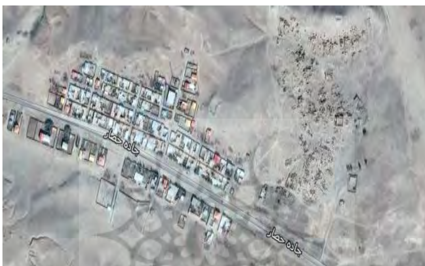
شکل ۳. روستای جابجا شده طبلشکین

همان طور که نتایج جدول (۱۰) نشان می‌دهد، از بین مولفه‌های سه گانه مورد بررسی در این مطالعه تنها مولفه توسعه اقتصادی با مقدار آماره f(8,311) براساس آزمون برابری لوز تفاوت معناداری را در بین دو سیاست اتخاذ شده برای بازسازی روستاهای آسیب دیده نشان می‌دهد. به طوری که، می‌توان گفت که بازسازی در روستاهای جابجا شده با توجه به مسافت کمتر در انتقال روستا به مکان جدید و نیز ارایه مشوق‌های اقتصادی از قبیل وام‌ها و اعتبارات بازسازی بیشتر برای ساخت مسکن، اعتبارات بازسازی واحدهای دامداری، انتقال عمدتاً به حاشیه جاده‌های مواصلاتی و نقش آن در بهبود ارائه محصولات برای مسافران و گردشگران (با توجه به این که راه‌های غرب به شرق بویژه در نیمه غربی شهرستان که بیشتر روستاهای جابجا شده در آن قرار دارند، اتصال دهنده شهرستان خدابنده به استان قزوین و تهران می‌باشد و تعداد مهاجرین زیادی در شهرک‌های اقماری تهران و قزوین دارای اصالت شهرستان خدابنده می‌باشد و جاده آبگرم به قیدار راه اصلی تردد بین زادگاه و محل زندگی آنها می‌باشد در زمان تردد برای خرید سوغات و در برگشت برای خرید ملزومات و کالاهای کشاورزی و باغی بازار مناسبی را مهیا می‌کند) و ... موفق تر بوده است.