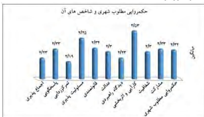
شکل ۳. میانگین شاخص های حکمروایی مطلوب شهری در شهر همدان

از طرفی مسئولیت پذیری ۲/۴۵ و میزان قانونمندی ۲/۳۴ بود. در مجموع سطح حکمروایی مطلوب شهری با مقدار ۲/۳۲ در وضعیت نامطلوب قرار دارد.